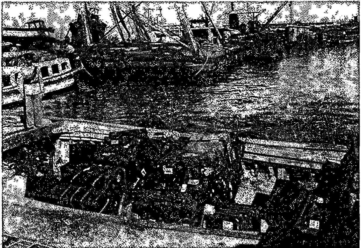
מוזרות עולים בנמל תל-אביב (אוקטובר 1938)