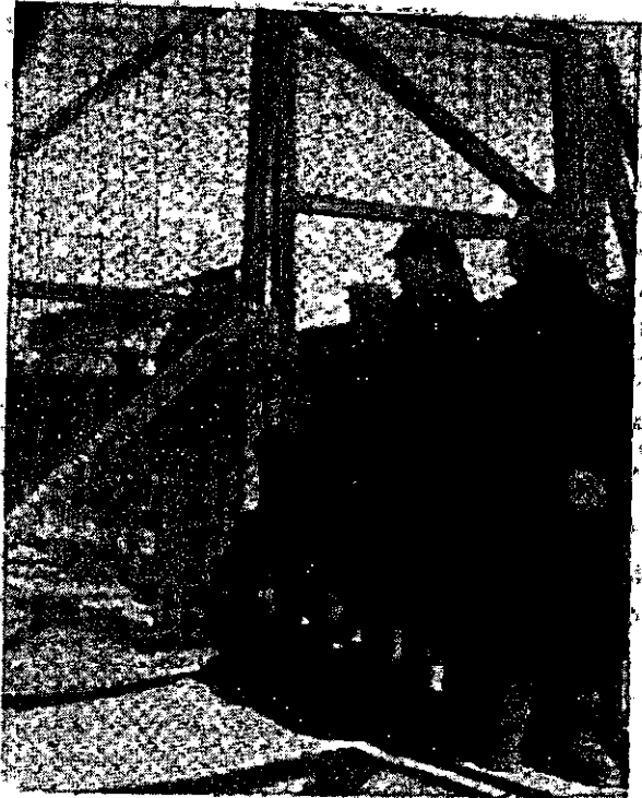
כשער מחנה העולים בעתלית (נובמבר 1944)

את בעיית ארץ-ישראל, שכן העלאת פליטים כה רבים תהפוך את היהודים בארץ ממיעוט לרוב, ותפתור את הסכסוך בינם לבין הערבים. 39