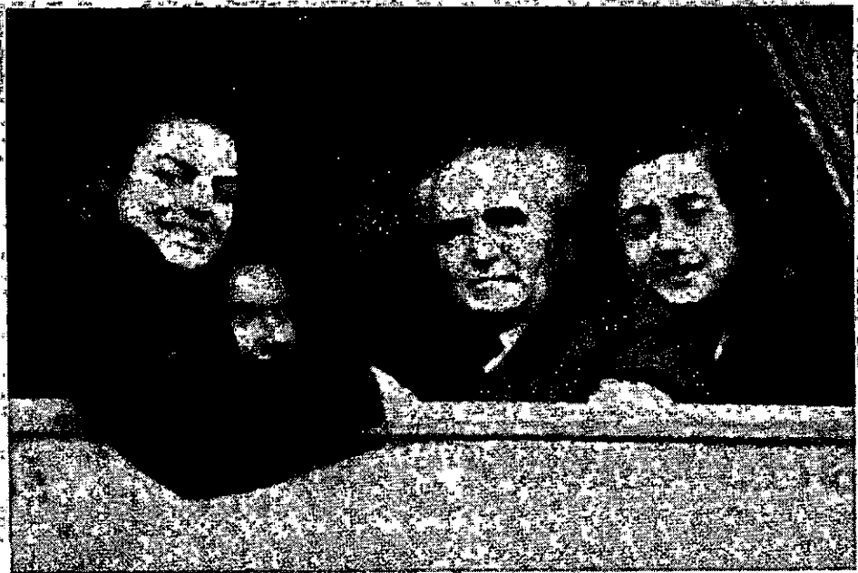
בן-גוריון ברכבת בדרך לבולגריה (דצמבר 1944)