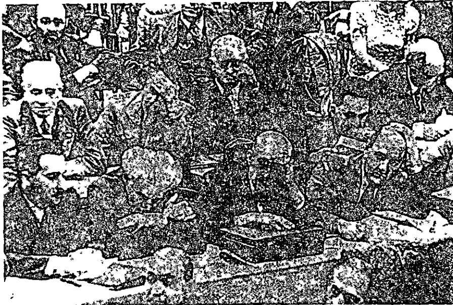
ישיבה בקונגרס הציוני הביאי, שבמהלכו פורצה מלחמת-העולם השנייה (גניבה, תחילת ספטמבר 1939). בשורה השנייה (מימין לשמאל): אליעזר קפלן, חיים ויצמן, דוד בן- גוריון, משה שרתוק

התעלמות מהבעיה הלאומית... [משמעה] דחירה תחת אשיות הציונות ופיתוי שכל ציוני חייב ללמד את עצמו לדחותו מכל וכל. 4