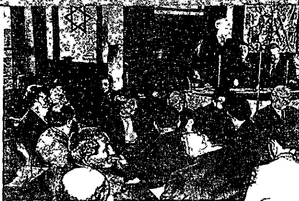
בן-גוריון כותעידה הציונית הראשונה לאחר סיום מלחמת-העולם השנייה (לונדון 1945)

וראשונה בהכשרת עילית מצומצמת ונבחרת. בעניין זה העמדה בהגקט 'הקיבוץ המאוחד' בפועל היתה דומה לעמדת 'השומר הצעיר'; שתי התנועות התנגדו בתוקף להצעת מפא"י להקמת 'החלוץ' האחד. חזית משותפת זו, שבאה לידי ביטוי בדיון שנערך לקראת אישור ההצעה, נוצרה אף-על-פי שעמדותיהן העקרוניות והמוצהרות של שתי התנועות בשאלת העלייה ההמונית היו שונות לחלוטין; אלא שדו-הפקטו טבנקין ו'הקיבוץ המאוחד' קיבלו במידה רבה את עמדת 'השומר הצעיר' בוכות עלייה סלקטיבית ונבחרת. עמדתם המשותפת בסוגייה זו לא נבעה רק מקוניקטורה פוליטית. 52