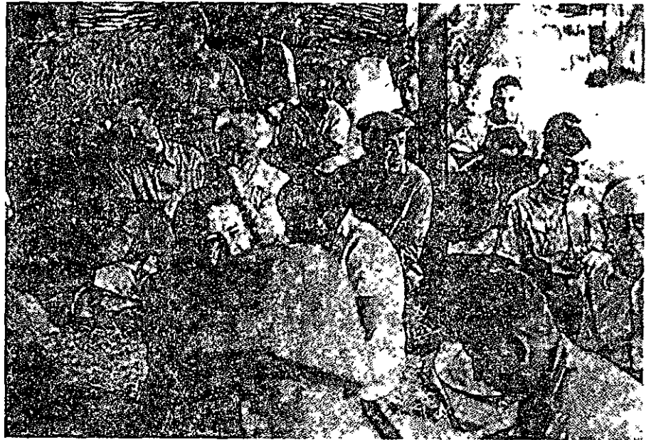
מועצת ההסתדרות באיילת-השחר (יולי 1943). במרכז - בן- גוריון ולשמאלו - טבנקין

אפוא משמעות רבה לא רק כשלעצמה, אלא גם מבחינת המאבק הציוני. בראשית 1943 אמר בעניין זה: 'מה בצע במלחמה ובנצחון אם עד תם המלחמה אירופה תהיה בית קברות יהודי'. 23 ניתן לראות במשפט זה ביטוי, נדיר למדי, של כאב ושל תחושת אוכדון, 24 אך ניתן לראות בו גם קביעה, כי התכנית המדינית הציונית, שהנצחון במלחמה היה תנאי הכרחי ומרכזי בהגשמתה, תאבד את כל ערכה ומשמעותה, אם אחרי המלחמה לא ייוותרו יהודים באירופה. אחר הגורמים למעורבותו בתכנית להצלת יהודי הונגריה שהוזכרה לעיל, היתה תחושתו כי יהדות זו אמורה להיות מרכיב מרכזי בשארית הפליטה, שאותה עת, על סף סיום המלחמה, הפכה להיות מרכיב יותר ויותר מרכזי במדיניות הציונית ובשיקולים הציוניים. 25 גישה זו באה לידי ביטוי גם כהתייחסותו לשליחותם של הצנתנים הארץ-ישראלים לאירופה. כשנשאל בן-גוריון על-ידי יואל פלג, 'עב צניחתו, 'מה הוא התפקיד המרכזי המוטל עלינו? מה היא ברכת הדרך המלווה אותנו?', תשובתו היתה, 'שיהודים ידעו שארץ-ישראל היא ארצם ומעוזם'. 26 ולצנחן חיים חרמש אמר, כי מטרת הצנחנים היא שהשרידים יתדפקו בהמוניהם על שערי הארץ הנעולים כדי לפותחם מיד אחרי יום הנצחון. 27 העמדה שראתה את שאלת גורל העם היהודי באירופה ואת שאלת ארץ-ישראל כשני צדדים של