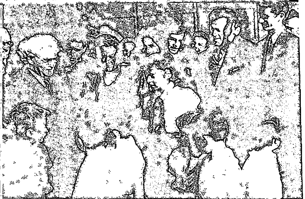
בן-גוריון מבקר במחנות העקורים בגרמניה

הוצאת ילדים ממחנות הפליטים והעברתם הזמנית לצרפת להחליש את המאבק לעליית כל הפליטים לארץ ישראל. 7