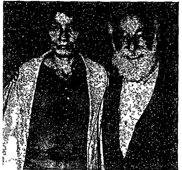
צביה לובטקין ויצחק טבנקין, 1964

חרדה, כי עתידו של היישוב היהודי בארץ-ישראל לוט בערפל ומוטל בספק, וכי העם היהודי חי לפתחו של הר געש; כי אסון איום רובץ לפתחו של העם היהודי ולפתחה של התנועה הציונית. במקביל, הוא הונע על-ידי האמונה, כי החלופות ביניהן יש להכריע הן 'או הגשמה מהירה של הציונות או אוכדנה', שהרי 'אם לא תתגשם הציונות במהרה, היא לא תתגשם כלל'. 40