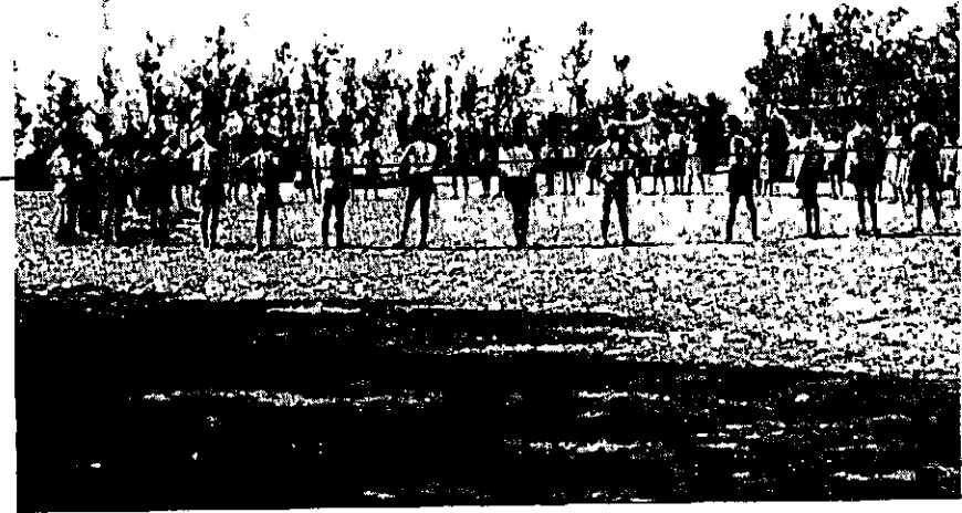
מפקד בוקר בחמאט אונסט 1949-

התנועה במרוקו פעלה במו התנועה בתוניסיה: פגישות קבוצות, לימוד עברית, לימוד שירים, מסיבות שבת, טיולי יום ראשון ומחנות קיץ (הראשון שבהם ב-Camp Bouleau, בסביבת קזה, בקיץ 1949 המדריכים השתתפו בסמינרים, שאורגנו ע"י התנועה עבור שלוש הארצות בצפון אפריקה, ואחר נ בסמינרים בצרפת. עם הקמת המבון למדריכי הו"ל של הסוכנות היהודית בארץ, נשלחו מועמדי מתאימים להדרכה מהתנועה, והם חס שהיו את עמוד השדרה של הפעולה החינוכית במשך כל שנו פעילות התנועה. גם במרוקו היו חברי התנועה פעילים ביותר בארגון התגנה העצמית ובארגון קבוצו העלייה הבללית. במרוקו כמו בתוניסיה ובאלג'יריה, פעלה התנועה כתנועה המונית, וניסתה יחד עם להגיע לנוער המשכיל. כמו בשאר הארצות, העלייה לארץ הייתה המטרה בה"א הידיעה, וגם כאן הי קשה ביותר לתברות התנועה לשכנע את הוריהן במתן רשות לעלות במסגרת קבוצה. לפעמים ג לחברים היה קשה להתנתק מהמשפחה בהיותם תומכים חשובים בפרנסת המשפחה. אך הנערי והנערות עשו זאת, עזבו את הבית, והצטרפו לגרעיני התנועה. ב-1951 מנתה התנועה 320 חברים באוו הערים שהוזכרו לעיל. הפעילות של השליחים-המדריכים לא התנהלה תמיד על מי מנוחות. בקרב הציב היהודי המסורתי היה לתנועה דימוי אנטי-דתי, אנטי-סמכותי-משפחתי. אך דימוי שלילי זה לא עצר א הנוער.