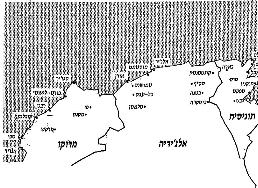
מפת הסניפים שהוכרו בחובת

רוב חברי התנועה בעלותם ארצה השתלבו במגזרים היוצרים של מדינת ישראל. הערכים, שקיבו בתנועה, נטעו בהם כוח להתמודד עם קשיי הארץ החדשה ולהשתרש בה. עד היום השים החברני נאמנות לערכי העבודה, יישוב הארץ והצדק החברתי אליהם חונכו.