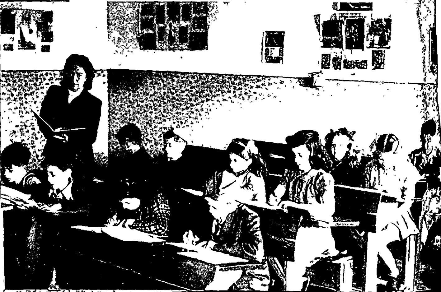
שיעור בבית הספר בפלדפינג, 1947

"הבעיה המרכזית העומדת בפני המחנכים היא לטהר את העובש הגלותי ולטפח יהודי חופשי חדש. אנו חייבים את הדור המתפתח לחיים בארץ משלו, כמו לעם בעל מסורת ותרבות רבת שנים. ערכים חדשים נחשפים בפנינו, ואנו חייבים למוזג לתוכם את כל המורשת הרוחנית והתרבותית שלנו. היו זמנים, כאשר החדר המשפחה, בית המדרש, היו הגורמים החינוכיים היחידים עבור הילד. עתה צריך להיות בית-ספר יהודי-לאומי, ועל המחנך שלו, שעליו מוטל התפקיד הקדוש, להיות מכשיר לדור הגדל להכשרה חלוצית... להקרה לטובת העם היהודי... לכל הנוכחים יש רק משאלה אחת: בית הספר שלנו שוקד על יסודות חינוכיים לאומיים: אהבה לארץ-ישראל, תיעוב הגלות, תבונות של החלטיות להיות חבר חופשי בעם חופשי בארץ משלו".