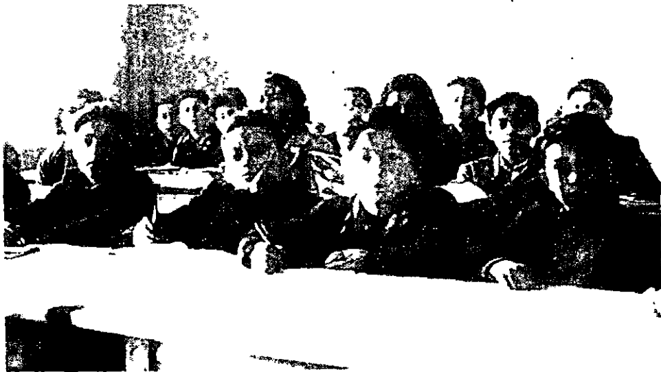
ילדים בבית הספר במחנה רוזנהיים, 1946

מתוך אותה מחויבות לעבר ניסח "המזרחי" תוכנית חינוכית, שבמרכזה הועמד חידוש החיים התורניים בארץ-ישראל כביטוי לסינתזה ייחודית בין יהדות לציונות, בין עבר לעתיד, בין תלמוד לבין מעשה. מתוך אותה מחויבות לעבר ניסח "המזרחי" את תוכניתו החינוכית באלה המלים: "ראשית יסוד היסודות של תוכניתנו: תורת משה וארץ-ישראל על-פי תורת ישראל!... כל האנרגיה שלנו וכל כוחותינו תיבנים להיות מגויסים למען תורת ישראל וארץ-ישראל. אנו חייבים להכשיר את המחנה ואת ההמונים הדתיים ללכת אל ארץ-ישראל, ולהיות שם, מה שהם מחויבים להיות: הבונים של ארץ-ישראל התורנית!... אם שאלת החינוך