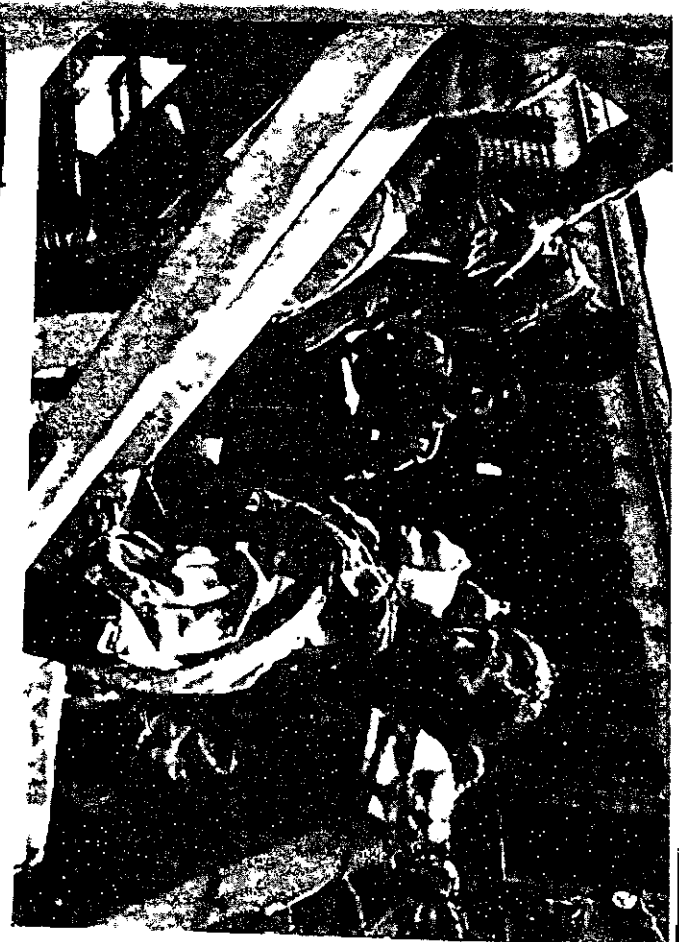
שוב מאחורי גדרות וחלל — אנשי שארית תפליסה שעלו ב"ציאת אירופה" תשי"ז מועברים למחנות המגו ברומה-ידי הפיר ליבק

בד כבר עם פעולת הגיוס והתחלה פעולה רבת-תועפת לאסוף כספים. למפעל התבטחו. בכל המקומות אורגנו ועדות המגבית והעבודה דוכות על-ידי ועדת ארצית שבראשה עמד סגן-ידיד דודנד המרכזי שילומוביץ. תועפדה השליחה מכסות על כל מקום. ומחנות חרש חלקי מאספקתם וכן דחשו מכלי-פריש ופשיט תחומה לפי הערכת הורעדה. הוצאות המגבית עלו כל כל האומותים. גאסוף-ברומה-ידי בשנת תשי"ח והאשיה תשי"ט סכום אשר עלה בהבנה על דההרבה הדובר יעשה, רושם גדול ברונו ההנהלה הציונית. עם זאת, יש לציין כי המגבית התפועה לא מעש על-ידי פעולה נפרדת של אנשי תאצ"ל שאספו כספים לק"ר א"ב"ר"ל" שלגם, אם פעולת הגיוס בצעה בעיקרה על-ידי שליחי תאצ"ל ואנשי למקום עבדו תחת דזרכתם, הרי המגבית נישאת על כתפי העסקנים המקומיים והיא נעזרת על-ידי השליחים במידה