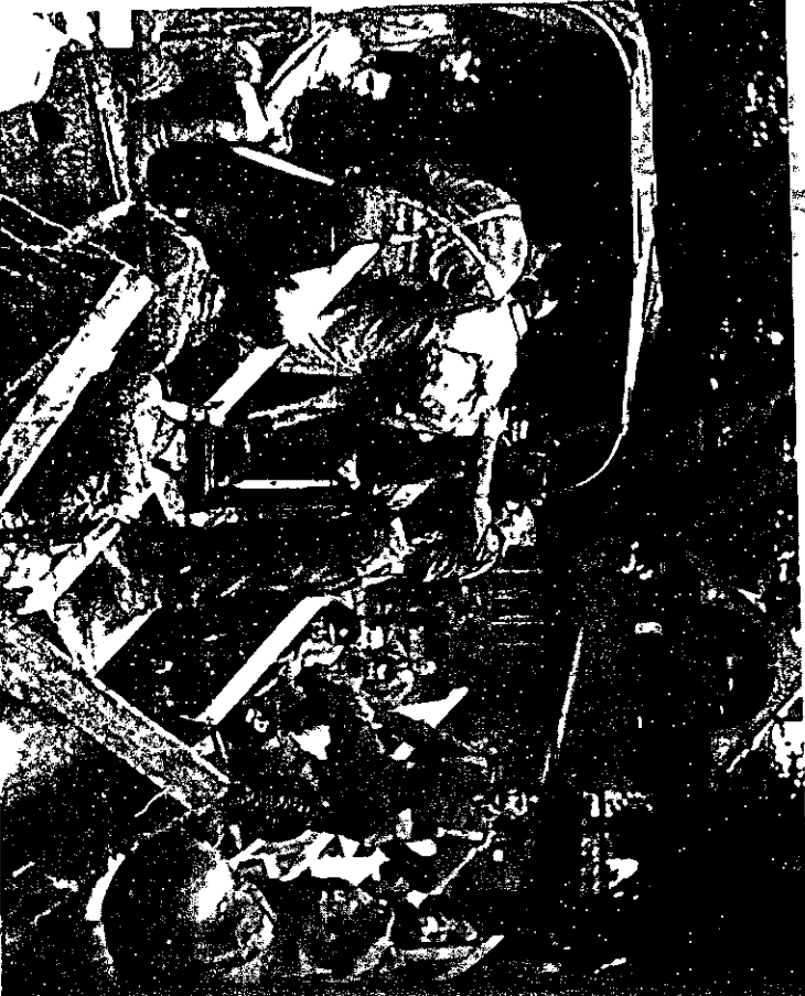
אלפי מנצייס, יוצאת ארופה השנייה מחזורים למחנות בירמניה

עמתי קצרונו את פרי עמלת של משלחת העמנה החוות בה קיימנו את בריה מספר של העמנה העפכה למתה-אימונים בו עבר מחזורים-מחזורים של מתנדבים