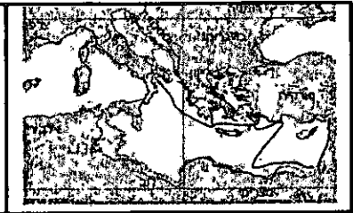
מסלול "שבתי לוז'ינסקי"