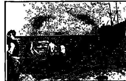
חזרת מעפילי "שבתי לז'ינסקי" בחוף ניצנים

במבצע זה הצליחו להגיע אל החוף כ- 350 ממעפילי "שבתי לז'ינסקי". עם בוקר, גילה מטוס סיור בריטי את הספינה והזעיק כוחות צבא. במקביל דאגו גם אנשי ה"הגנה" להזעיק מאות מתושבי הישובים בסביבה, להגיע למקום. הצבא הבריטי הקיף את האיזור כולו, וכל הנמצאים על החוף הועברו למחנה הצבאי הקרוב. אך הבריטים לא הצליחו לאתר מי מבין העצורים הם המעפילים, ומי מהם מתושבי האיזור.