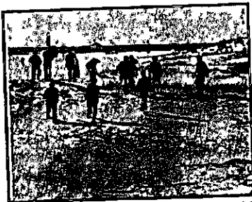
חיילים בריטים במרדף אחרי מעפילי "שבתי לוז'ינסקי"

בליל ה-9 במרץ, כאשר התקרבו הספינות סמוך לחופי תורכיה, עלו נוסעי "פטרי" על סיפונה של "שבתי לוז'ינסקי", והספינה הקטנה שבה על עקבותיה.