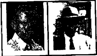
משה דפני דני סנדלר

"ההפלגה הזאת לקחה שבוע. רב החובל ידע את העבודה הדרושה על הגשר, ולשים קו על המפה, אבל ביתר הדברים אמר לי: 'תעשה מה שאתה מבין'. לקחתי ארבעה בחורים שיעזרו בעבודה. התקרבו לארץ, התחיל לרחף מעלינו אווירון. רב החובל נבהל. הושבתי אותו בין העולים. התחילו לבוא משחתות. אמרתי לאנשים לא להתנגד. אף אחד לא עשה כלום, ואני עצמי ירדתי מהגשר לסיפון, לילדים. אחרי מה שעברנו ב'לנגב' חשבתי שאין טעם להתנגד, העיקר להגיע בשקט ושהאנשים לא יושפלו ולא יפגעו כפי שקרה ב'לנגב'. הועברנו לקפריסין. אני ירדתי כעולה חדש כשגליה בזרועות". (3)