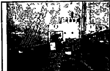
הספינה "סירת צבי"