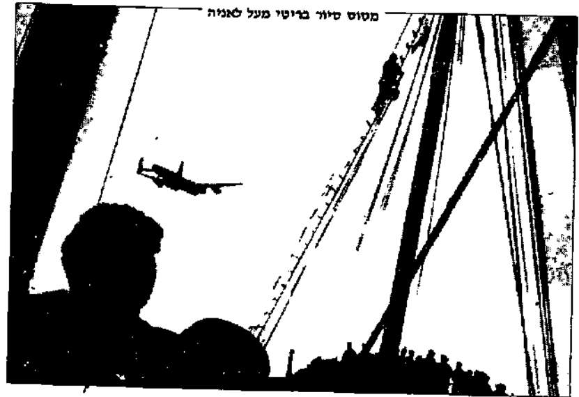
מטוס סיור בריטי מעל לאנייה