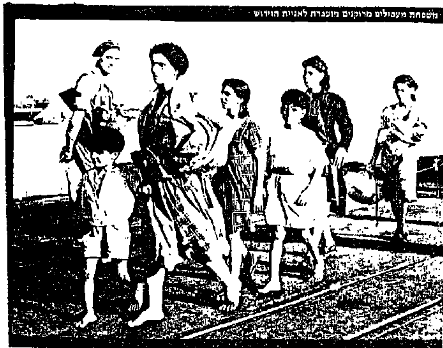
השפחה מעפילים מוקנים מונגרת לאניה הנידוש

אני זוכר את המעמד, חיילי הוד מלכותה עומדים זה מול זה בשתי שורות כשרובים לידיהם, מגוחצים ומצוחצחים, כשבתווך ערב רב של אנשים, של זקנים, נשים וטף, צרורותיהם בידם, לבושים דהוי ובלוי, כובעי קסקט לראשם, הנשים במטפחות ראש, בגדים מכל הגוונים. ניגוד כה בולט, עצמה מול חולשה, צבא מודרני מול פליטים למודי סבל, צעירים חסונים, מול זקנים וילדים. המצעד התנהל לו בדממה עד לבטן האניה.