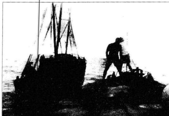
"Maria Anick" הגיעה לארץ כספינת מעפילים "הפורצים"

עם הכרזת הפוגה הראשונה במלחמת העצמאות ירדתי