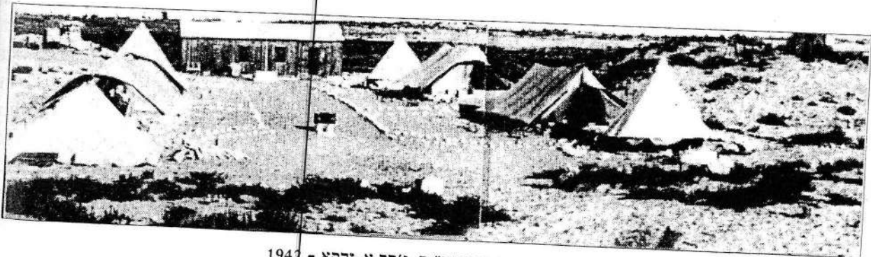
מחנה "משמר החופים" ב-ג'סר א-זרקא - 1942

אני מברך את היוזמים לעריכת האסופה של סיפוריהם וזכרונותיהם של מי שהשתתפו בפעולות הישוב העברי להעלות מעפילים מתדפקים על שערי הארץ. יישר כוחכם!!