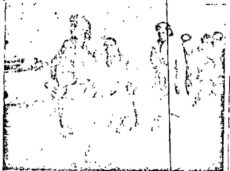
עולים מן האניה "שיבת ציון" מועברים לאנית הגירוש

הספינה נתקרה למחוז הפריקה בשעל ספינה וכלל אשכנזים פוסטסיים מאות