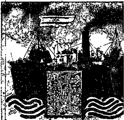
מול השער הנעול

האודיסיאה של 3,845 מְעִפְלֵי "כנסת ישראל" משקפת את כל ההעפלה לארץ ישראל