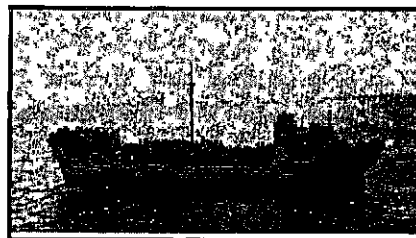
הספינה "משמר העמק"