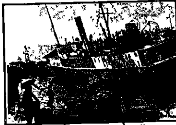
"מולדת" נטח על צידו

המבנה המיוחד, הגבוה, של "מולדת", גרם לכך שבמשך ההפלגה איבדה האניה את יציבותה, עד כדי חשש להתהפכות, ואף לטביעה.