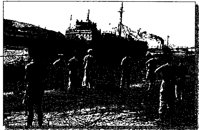
"מדינת היהודים" מובאת לחיפה

למרות ההוראות, התנהל קרב השתלטות מלווה בהפגזת פצצות גז מדמיע של הבריטים, ובשל כך נספה תינוק. הבריטים הצליחו להשתלט על הספינה במרחק של כ-5 מיל מתוף תל-אביב. הספינה נגרדה לחיפה והמעפילים גורשו לקפריסין. רוב המלווים ואחרים מהצוות הולצו. אחרים הצטרפו למעפילים וגורשו אף הם לקפריסין.