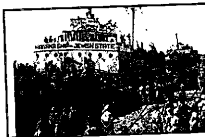
הספינת "מדינת היהודים"