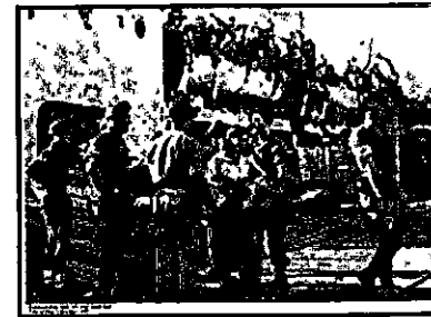
חבריטים מורחים מעפל פצוע מ"מדינת היהודים"

יחד עמה יצאה בשיירה גם "גאולה" על מעפיליה. שתי הספינות שטו זו בצד זו, כאשר על פי התכנית אמורה היתה "מדינת היהודים" לקלוט חלק ממעפילי "גאולה".