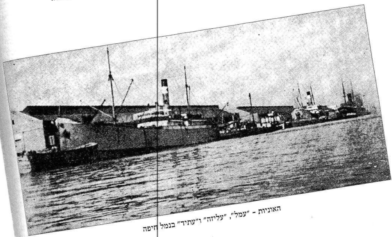
האוניות - "עמל", "עליזה" ו"עתיד" בנמל חיפה

ומי יודע על כמה שיירות חלוצים עוד יוטל כמונו לשים את נפשם בכף ולעבור את הדרך הזאת של שילוח מן הארץ, חנוקים מגזים מפצצות הנקלעות דרך כל אשנב וסדק לתוך בטן האנייה המשמשת לנו הפירה אחרונה בפני הידיים המושטות לתפסנו. לא נגעה לליבם שירתנו המלוכדת, שירת ההמנון ושירת הגטאות, מכונת השילוח והגירוש לא הפסיקה את פעולתה. ראשונים נרתעו מפני שורותינו המתגוננות, אחרים באו תחתם. מוכים היינו, אבל לא נתנו גוונו למכים, כל עוד לא פורקנו ע"י הגזים המחניקים. אחד אחד סחבנו וביצעו את זממם.