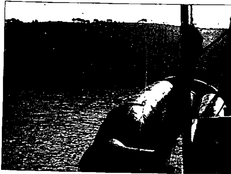
חוף דרום-צרפת — עליה לאניה בסירות גומי

ואמנם, בצהרי ה־10 במאי, נראתה "אטאל" בחופי אלג'יריה. מול מחנה "שלוות ובריאות". נדיה פרנקו, שראתה כבר את האנייה במארסי, זיהתה אותה מיד וכמוסכם — ענן עשן גדול עלה והיתמר בשטח המחנה. לאחר שקלט את האות, חמק רב החובל הספרדי מן המקום, על־מנת שיוכל לשוב אליו עם חשיכה.