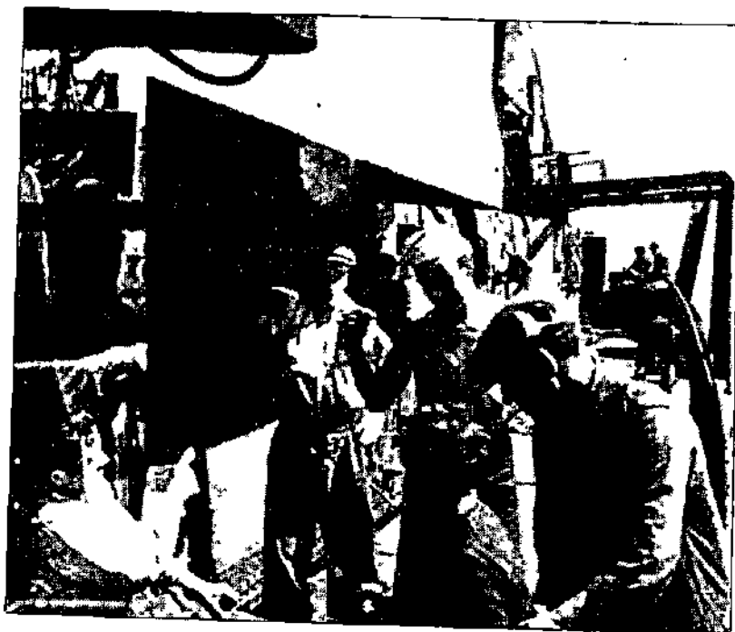
צוות האניה "נחשון" יושב משטאל: מפקד האניה יוסף אלמוג

כל שורה טופגת לכלוך מלמעלה ממנה / בלי חנינה; שתן תינוקות על ראשינו / מנה אחר מנה השיגונו; על חסיפון אין נפש חייה / אין תנועה על גג האניה; אך במרחק כמה קילומטרים מחיפה / גילו אותנו בחוצפה; כשראינו האנגלים / אין בפינו מילים / התקרבו לתפוס אומללים; 18 אוניות מלחמה סבבונו / גם כתרונו; ראינו אוניות מלחמה / ובחלה קמה; אחת האוניות נגחה אוניתנו הרעועה, בין רגע של שעה; האוניה נשברה לשנים / וכהנו עינים; קפצו החיילים מהאוניה הענקית שלהם / ומשק בדיהם; עם אלות בידם / לנו אין נשק נגדם; אז עלינו לגג האוניה ממחבוא לפקות עינים / ולנשום אויר מלוא הטחיריים; "אף על פי כן" צעקנו כולנו / ודגל הלאום על התורן הנפו / לקרב מוכנים אנטו; קבלנו תודעה מהסוכנות / לא לריב ולא לענות; חיש מהר התחילו להעלותנו / בסולם המחובר לאונייתנו; העלו נשים וילדים בנימוס נפלא / וכבוד מעולה; ובסוף עלינו כולנו / והנה ארמון מלכים מולנו; אוניה גדולה / הודה והדרה עלינו האצילה; אוניה רחבת ידיים / בעדי עדיים;