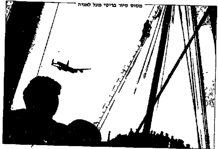
מטוס סיוור בריטי מעל לאניה