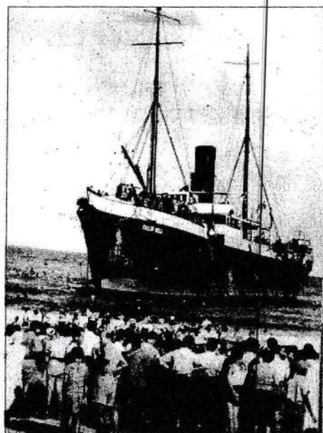
האוניה "טייגר היל" עם 1417 מעפילים בחוף ת"א ב-1.9.1939

האוניה מליל אמש הייתה "טייגר היל" שהביאה לחופי הארץ 1417 מעפילים. ליל "טייגר היל" נחרט במוחי והביא