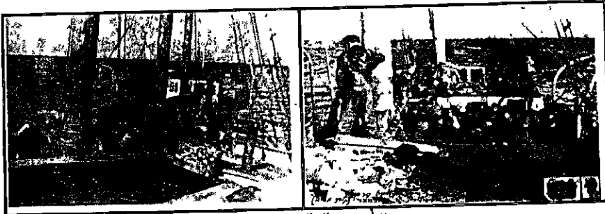
על סיפון "כ"ט בנובמבר"

מיוחדות. לאתר שעלו על הסיפון כ-80 מבין המעפילים, התגלתה הספינה על ידי השלטונות והיא נאלצה להפסיק את פעילותה ולהמלט בחופזה. אך ביש המזל רדף אחריה, והיא נלכדה על ידי כוח ימי איטלקי אשר גרר את "מריה ג'ובאני" לנמל בסרדיניה. לאחר זמן מה, תוך ניצול, חוסר ערנות מצד שלטונות הנמל, הצליחה הספינה להמלט, ולהפליג לכוון קורסיקה להמשך משימתה.