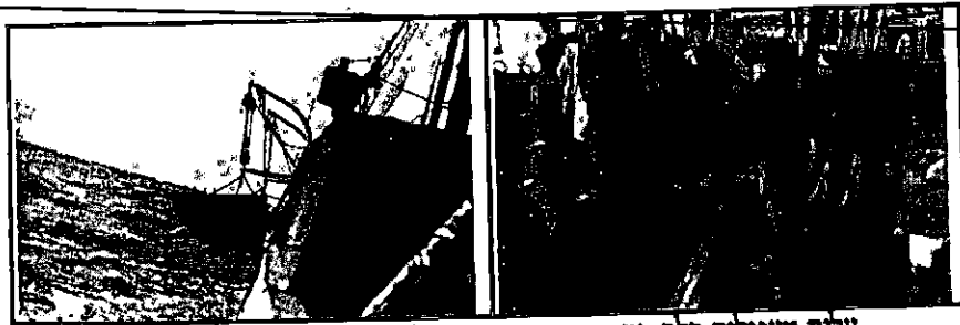
"כ"ט בנובמבר" מלב הסערה