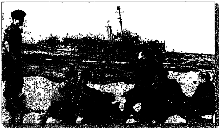
"חיים ארלוזורוב" על הסלעים, מול המחנה הצבאי הבריטי בבת גלים