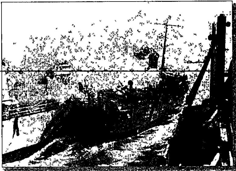
"חיים ארלזורוב" בקרב עם הצי המלכותי הבריטי

כאן גילתה "חיים ארלזורוב" את "הנשק הסודי" שלה. הוא היה שני תורני עץ, אשר בעזרת מערכת גלגלות הזדקרו משני צדי הסיפון בניצב לדופנותיה, ומנעו את היצמדות המשחתות. הצי הבריטי הופתע, אך רק לזמן קצר. המשחתות ניגשו מכיוון הירכתיים וניסו להנחית נחתים. ניטש קרב פנים אל פנים. לבסוף, ניגשו המשחתות מכיוון הירכתיים, במקביל לספינה, ופשוט "גילחו" את שני התרנים המזרקים והצליחו להנחית כמה חיילים על הסיפון. החל קרב פנים אל פנים. מטחי ברגים, קופסאות שימורים וסילוני מים נחתו על ראשי החיילים הבריטיים.