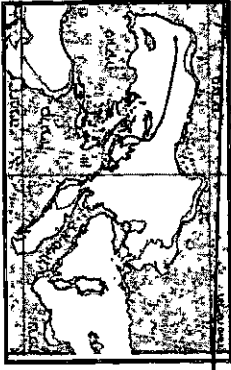
מסלול "הנרייטה סאלד"