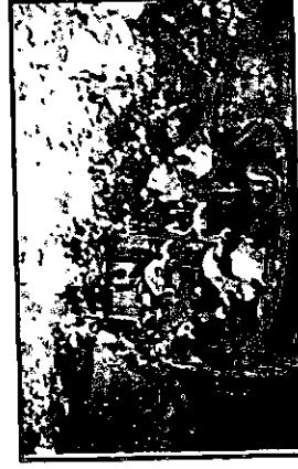
מעפלי "הנרייטה סאלד"

כבר בחחילת המסע יצאו מנועי "הנרייטה סאלד" מכלל פעולה, ו"רפי" נאלצה לגורר אותה לאחד האיים כים האגאי, סידונה.