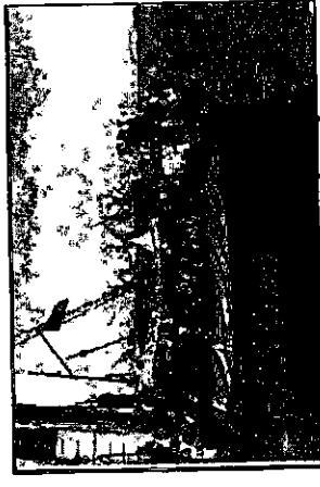
מעפילים על סיפון "הנרייטה סאלד"

ראכן, הבריטים, כלווי גורדות גבוהות, ארבע משוחות, כמו גם הסירת "אניקס", ארבו לספינה, ובסיוע זרנוקי מים, השתלטו על "הנרייטה סאלד", והעבירו אותה, על כל מעפיליה, לגמל חיפה. (3)