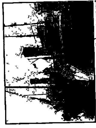
"הנרייטה סאלד" בין סידת משטרה בריטית

בליל ט"ז באב החל הצבא הבריטי להעביר את מעפילי "הנרייטה סאלד" לאנית הגירוש הבריטית "אמפייר הייברד". המעפילים הגיבו בהתנגדות פאסיבית מול הצבא שהשתמש מולם בסילוני מים.