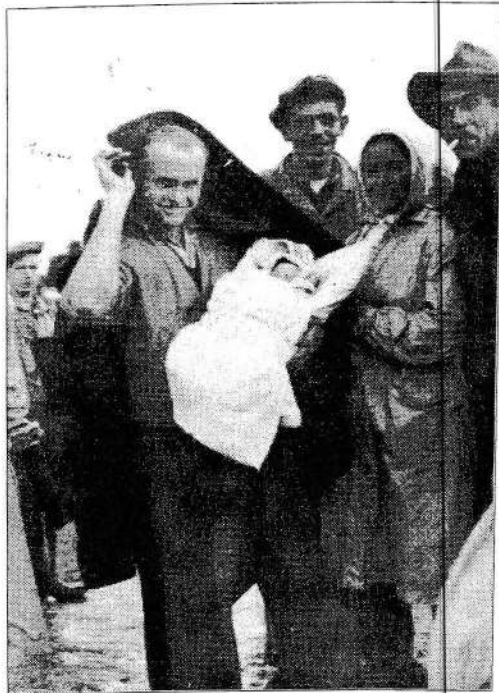
הפלמ"חניק המילד עם התינוקת "גליה" מהאווניה "ירושלים הנצורה"

עם תום מלחמת העצמאות, המשכתי זמן מסוים כימאי. עברתי קורס קצינים ועבדתי תקופות כקצין על אניה. עסקתי בעבודות שונות, בעיקר חישוב מנהרות, מקצוע שהשתלמתי בו. בשנת 1961 עברתי למושב שרונה. הקמתי משק שעיקרו עדר בקר לבשר. בו אני עוסק עד היום. במשך השנים נולדו לי בת ושלושה בנים, ומהם יש לי שישה עשר נכדים.