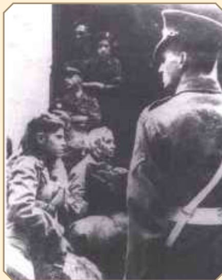
התמונה מעיתון יויד במאריס, ערב ראש השנה תשי"ח.

המסע שיכנס לספרי ההיסטוריה. אולם, לאחר מספר ימי הפלגה התהפך מצב רוחנו וכאב עז חדר לליבנו, כאשר התברר למעפילים שהם נצורים. האונייה אקסודוס, הוקפה על ידי משחתות קרב בריטיות... וכל זה קרה לפני שהחלום הוגשם, לפני שהספקנו לנחות בחופי ארץ ישראל."