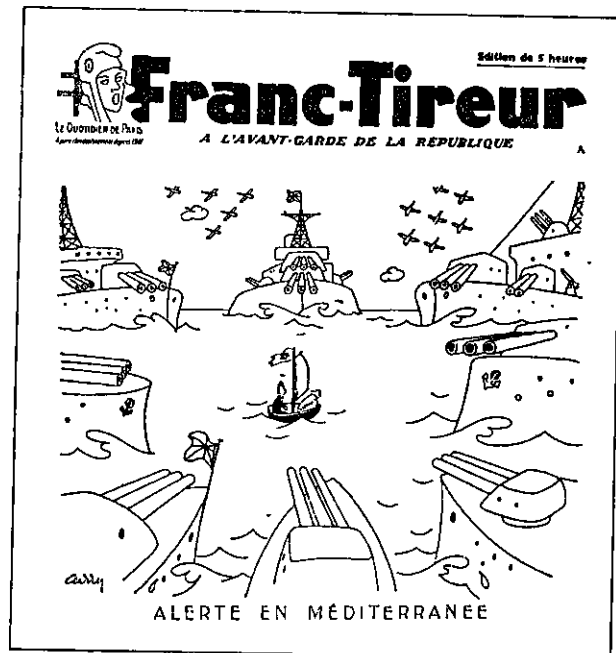
ית 'אקסודוס' — כקריקטורה בעיתון צרפתי

קציין בודק את 'טופס האשרה' שבידיה ועליו חמונתו של... יהודי קשיש מזוקן. הקציין הכיט בחמונה ובנערה ופסק: 'ס'ה פ'אן' — כסדר גמור.