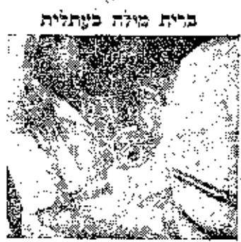
ברית מילה בעתליה

יום ומספרי קעקע שעל זרועם איכנו נותנים להם לעולם להשיג את דפי תם כמה שעבר עליהם שם. עתליה הייתה פעם רק מושב גיאר גראפי. בהצטלכות הדרבים שבקילור מאד ה'דן מהיטה לחל איכנו מהניסן שלקט בשלוש השפות הדישמיות: ערבי לית, אך בזכרונם של אלפי המקפילים היה המלה הזאת כזכרון עצוב. כצידו דרך מלא קוצים בדרך השחרות. לפי תים דחוקות ניתן לאדם בן החוג לפי מזל על סדרני של מונח זה. הדרבנות כואת" גייתה לנו השבוע על ידי לשי כה המודיעין הממשלתי. הרשם הי פאשון במבואות המחנה הוא מחנה עצורים לפי כל פרטיו ידקדקו ולפי כל החוג בברית אסורים בארץ.