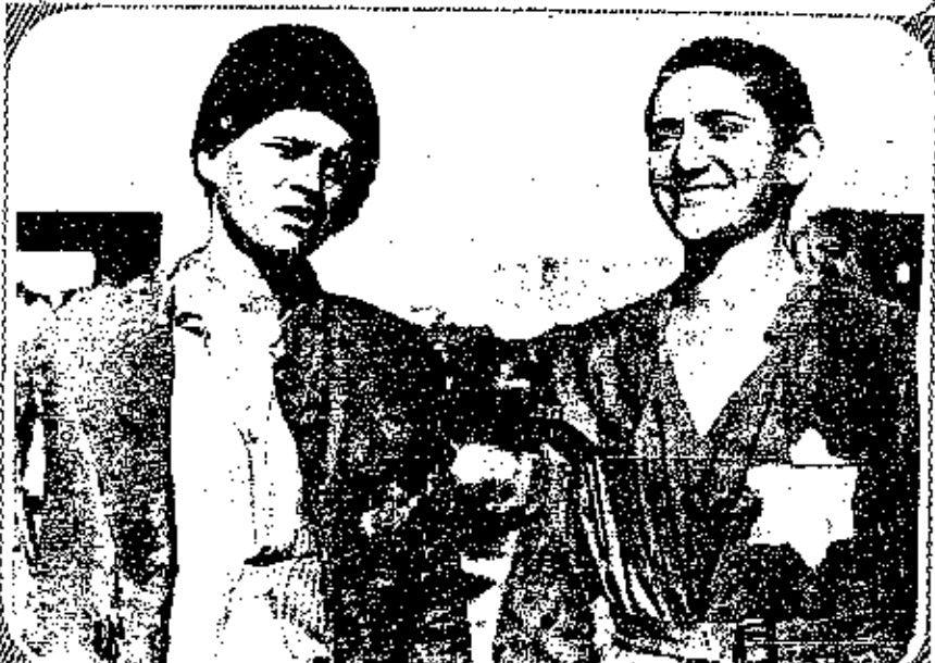
TWO YOUNG JEWS, TYPICAL OF THE ILLEGAL IMMIGRANTS WHO HAVE ENTERED PALESTINE IN THOUSANDS VIA HAIFA AND THE ATHLIT CLEARANCE CAMP.

Recent descriptions of the illegal arrival in Palestine of thousands of Jewish immigrants have referred to the crowded and insanitary conditions of the ships which brought them there, and to aged and sick persons being permitted to land immediately. The above photographs show the other side of the picture—the young Jews who comprise the majority of the thousands illegally landed at Haifa and permitted to enter Palestine via the Atlit Clearance Camp. This camp, described in The Illustrated London News of July 13 last, was established by the Palestine Government in effect to legalise the illegal entry