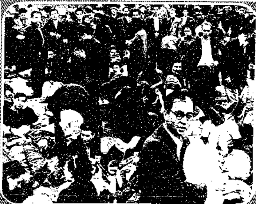
AFTER A HUNGER-STRIKE: SOME OF THE JEWS WHO WENT ON HUNGER-STRIKE WHEN THEIR IMMIGRANT SHIP WAS SEIZED AT LA SPEZIA BY ITALIAN AUTHORITIES.