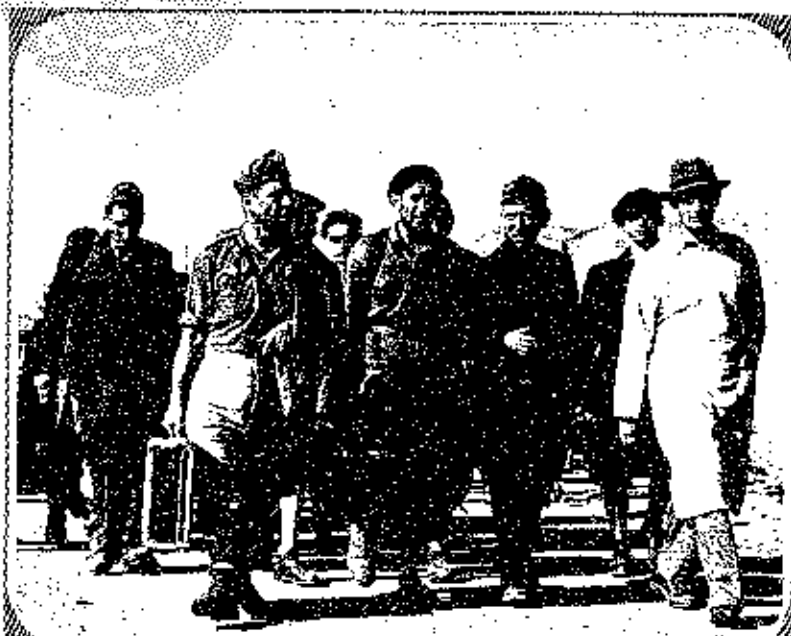
A TYPICAL GROUP OF ILLEGAL JEWISH IMMIGRANTS, DISEMBARKED AT HAIFA AND ON THEIR WAY TO THE ATHLIT CLEARANCE CAMP FOR "VETTING."