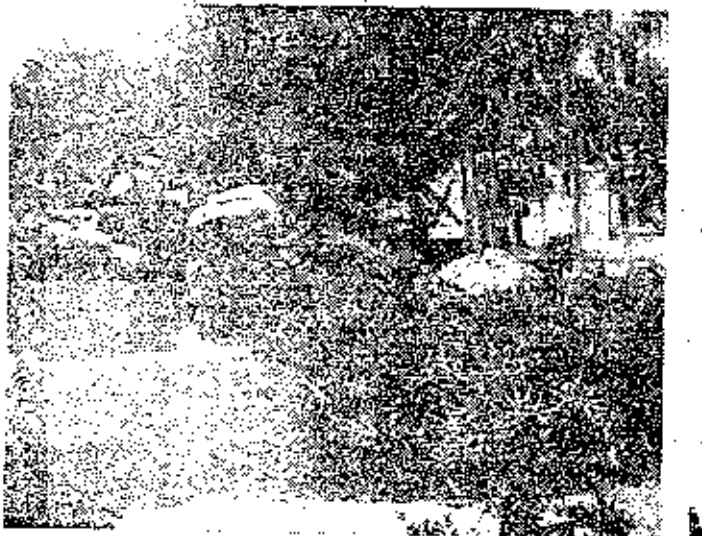
עמדה ליד הכניסה הראשית

תיל. עמדות גנון מכינת יריח את הפשטר האיומה השורר במחנה הזה מסמנת גדר התיל הכפולה ומכיר פלוג העוברת לאורך הכביש. כמעט עד שפת הים. הכניסה הראשית למחנה יש לה צורה של מבצר. מהוסמים מגלולי תיל דוקרני. עמדות גנון של שקי חול וקנים למטות יריות בתוכן משמר חיילים מיומן מקף רגל וער ראש נוסף על משמר הנוטרים ממשי טרת... פתי הסודר. ביקורת אחרונה של התעודות ואנו