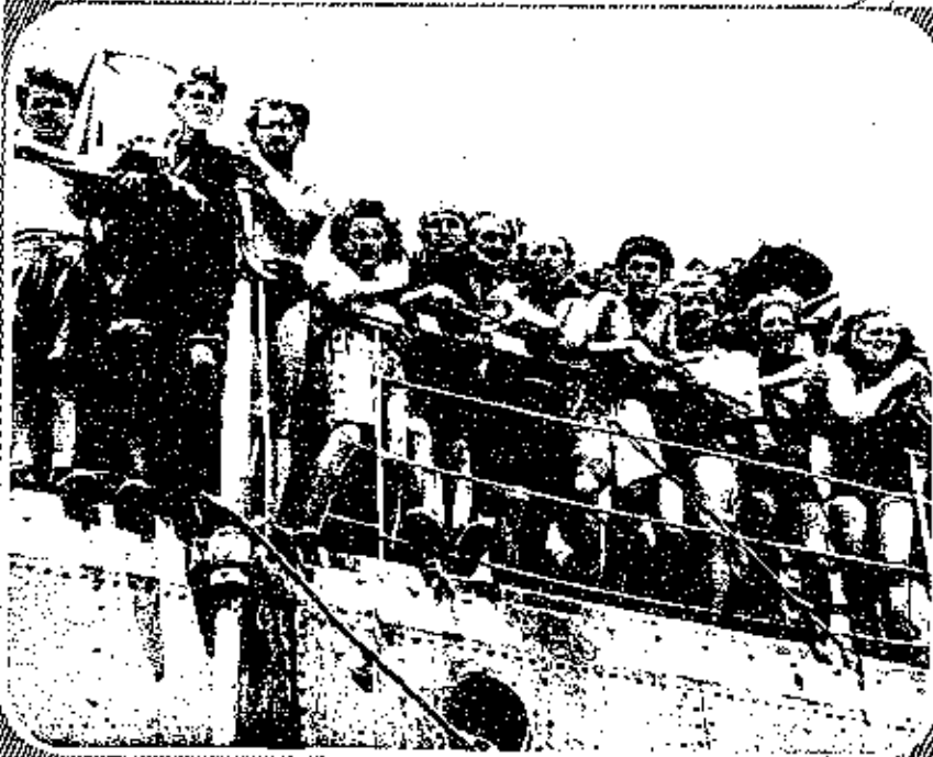
SCARCELY MORE THAN CHILDREN: YOUNG JEWISH IMMIGRANTS GAZING AT THE SHORES OF PALESTINE FROM THE SHIP WHICH BROUGHT THEM ILLEGALLY TO HAIFA.