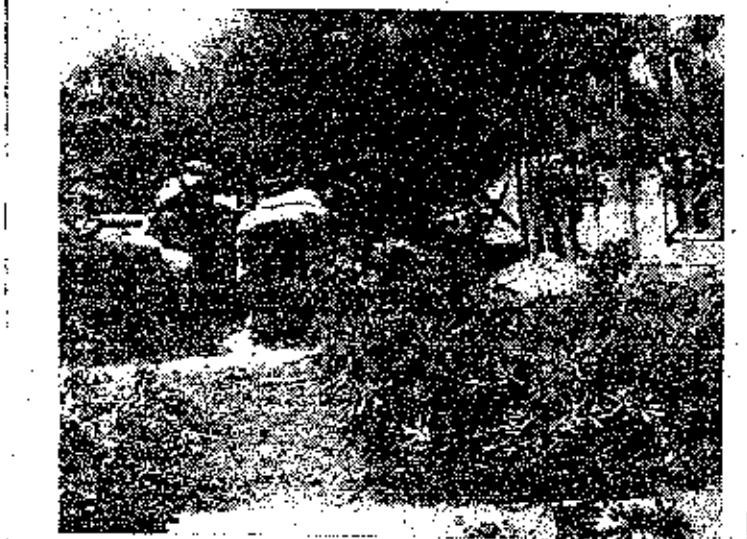
מורה ליד הכניסה הראשית

התענינותנו נתונה כמובן בראש וראשונה לתינוקות — לראות את פלאי עולם אלה שגם בחיתוליהם הם מהזים סכנה לבסחן האימפריה. ליד העריסה הראשונה מצאנו אם אומללה גועה בכלי. כהתקרבתי אליה. מהספי פת האם הצדה ומסתירה את רמנו תיה על זרועה השמאלית חרות מספר קעקע בן שש טיפרות וזכרון צצה מאושרי יוצי. היא סאותם בני המול המעסים שבאו ב-הנוייסה סולדי ולא גורשו לקפריסין. ללולי זה גרם התינוק שבעריסה. שחלת. היא