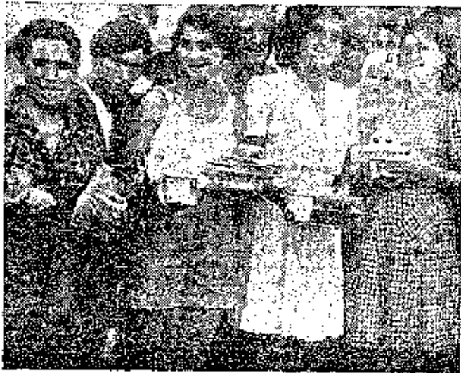
המקפילים ליד הסרפאח