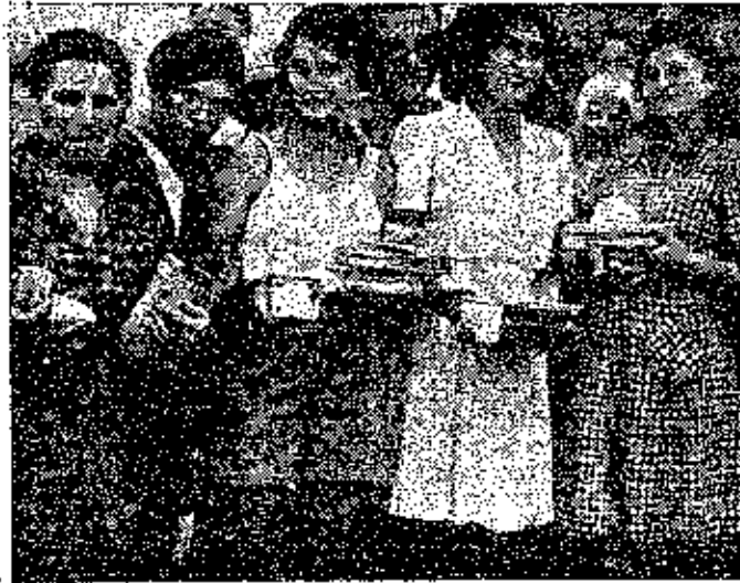
המעפילים ליד הסרפאח