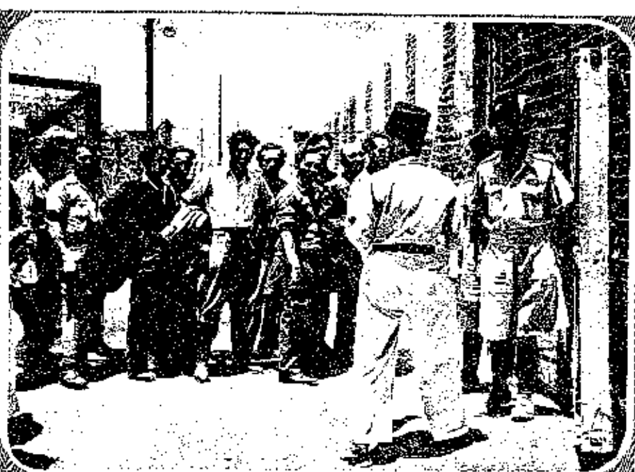
A BATCH OF HEFTY YOUNG JEWS, BROUGHT BY ILLEGAL SHIP FROM EUROPE TO PALESTINE, ENTERING THE ATHLIT CLEARANCE CAMP, NEAR HAIFA, FOR INTERROGATION BEFORE RELEASE.