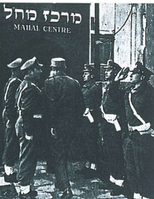
מפקד חטיבה 7, בן דונקלמן (קנדה), בפתיחת מרכז מח"ל בתל-אביב.

הביאו בהדרגה להקפדה יתרה ופיקוח על רישום וקבלת מתנדבים. כתוצאה מכך, לקראת שלהי המלחמה, הידלדל זרם המתנדבים ולמערכת הצבאית נתקבלו בעיקר מומחים במקצועות שונים, שנבחרו לפי צרכי הצבא. הללו הוסיפו להגיע ונקלטו במערכת הצבאית גם בשלהי תקופת הקרבות.