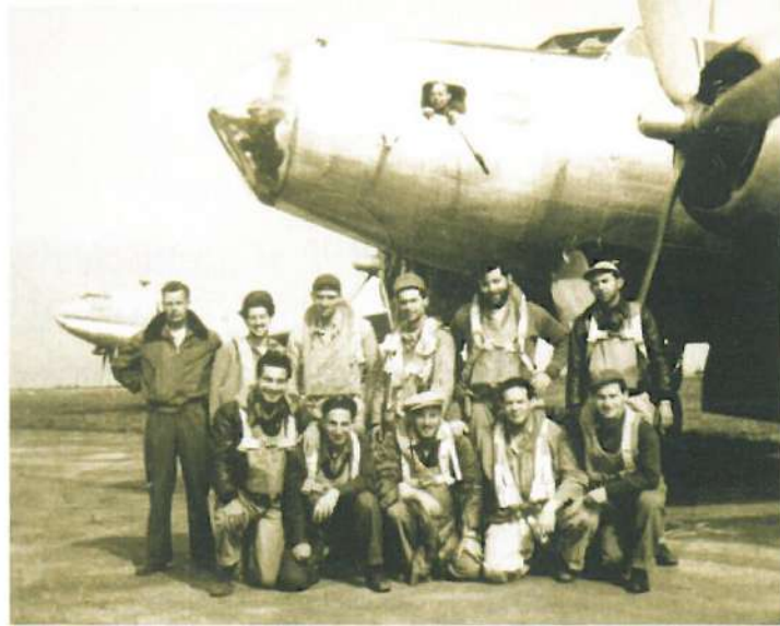
צוות מטוס B-17 בזאטץ, צ'כוסלובקיה, לפני המראה.