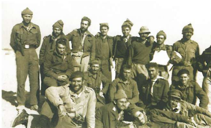
מחלקת מח"ל, גדוד 89, חטיבה 8 (מאנגליה, רודזיה, ארה"ב, הולנד, גרמניה ודרום אפריקה) לאחר כיבוש עוג'ה אל חפיר (ניצנה), דצמבר 1948.

חטיבת השריון 7 הפכה למעשה ל"חטיבת המח"ל". היא הורכבה מגדוד השריון 79 ושני גדודי חי"ר: 71 ו-72. בחודשי הקיץ היו בחטיבה כ-170 מתנדבים דוברי אנגלית ופלוגה אחת הורכבה בשלמותה ממתנדבים דוברי אנגלית. החטיבה השתתפה ב"מבצע דקל" לכיבוש הגליל התחתון ונצרת, בקרבות "עשרת הימים" ביולי 1948 ובמבצע "חירס" לכיבוש הגליל העליון והדיפת צבא ההצלה של קאוקג'י. בשלהי אוקטובר 1948 לקראת סוף המלחמה היו בחטיבה 7 כ-300 אנשי מח"ל מהם כ-240 בגדוד 72, כמעט כולם דוברי אנגלית.