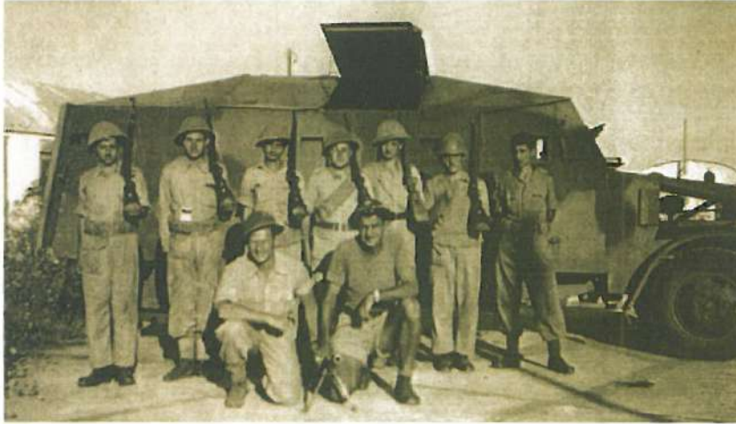
צוות שריונית ("סנדוויץ") מחטיבת אלכסנדרוני, גדוד 34. חלקם אנשי מח"ל מנורבגיה, דנמרק, דרום אפריקה, אנגליה וארה"ב.