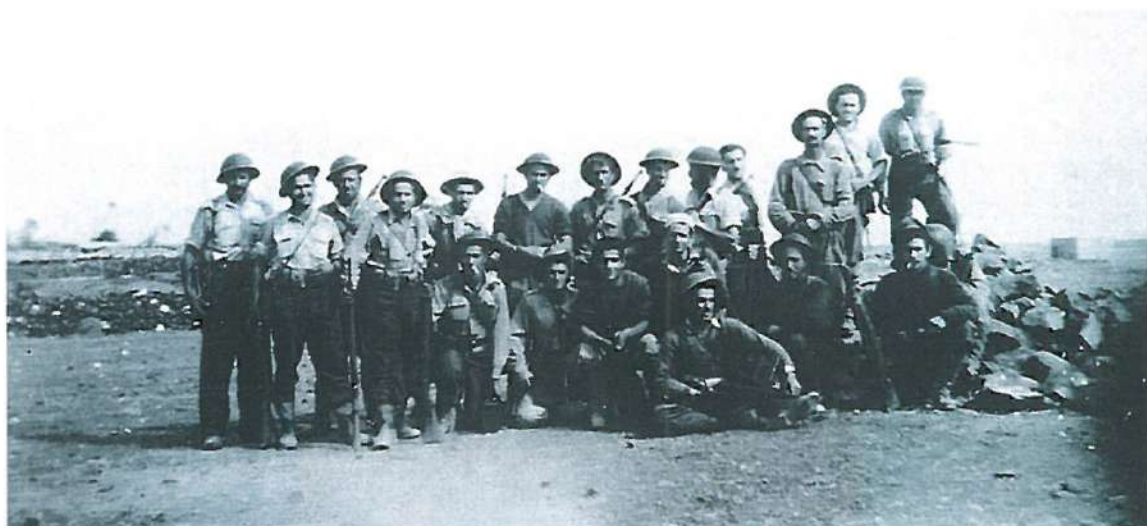
המחלקה הדרום-אמריקאית, גדוד 91.

ראשוני המגוייסים מקרב המתנדבים מנו כמה עשרות. הם הגיעו ארצה כבר בפברואר 1948, והשתתפו בקרבות (24 מן המתנדבים נפלו בקרבות עד ה-31 במאי 1948). מספרם של המתנדבים הלך וגדל לקראת יום הכרזת המדינה ועלה עוד יותר לאחר ההפוגה הראשונה, שנסתיימה ביולי 1948.