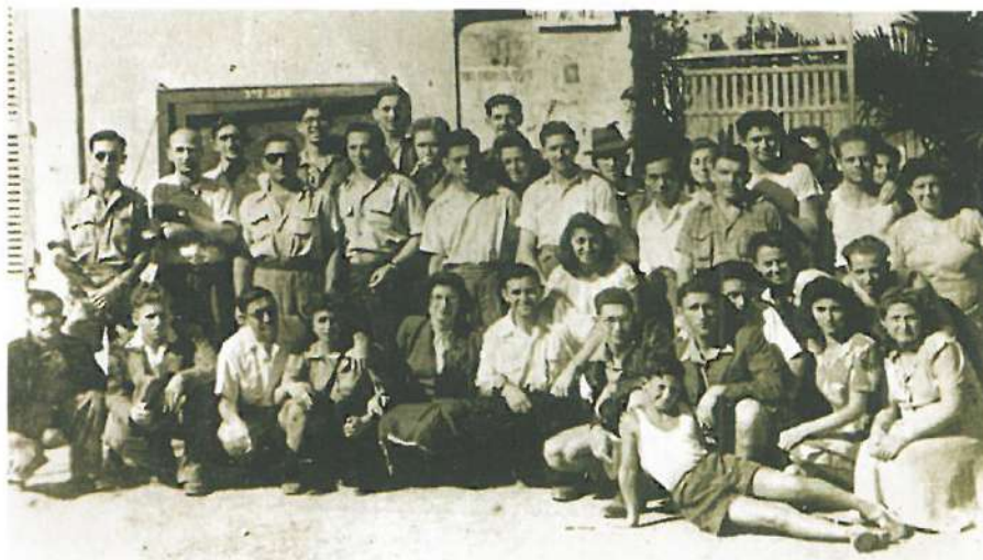
אנשי מח"ל מדרום אפריקה עם עובדים במחנה העקורים לדיספולי, איטליה, 1948.

המתנדבים, שרובם היו אזרחים אמריקנים וקנדים, סייעו לרכוש ולצייד את האניות שהיו ל"צי הצללים" של המוסד לעליית ב'. אילו נתפסו, עלולים היו לעמוד לדין על פי תקנות שעת חירום, על עזרה להגירה בלתי ליגלית, והיו צפויים לעונש של עד שמונה שנות מאסר ו/או קנס של 10,000 לירות סטרלינג.