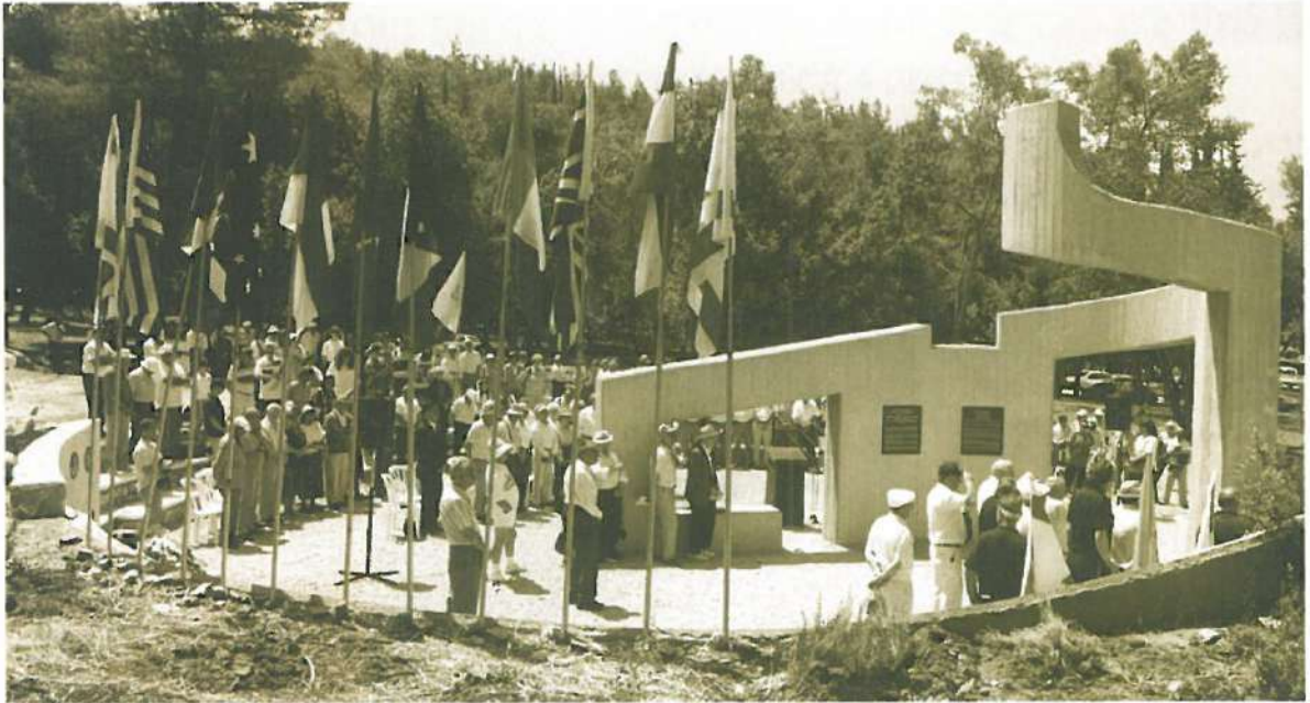
טקס חנוכת האנדרטה לזכרם של 119 אנשי המח"ל שנפלו במלחמת הקוממיות.