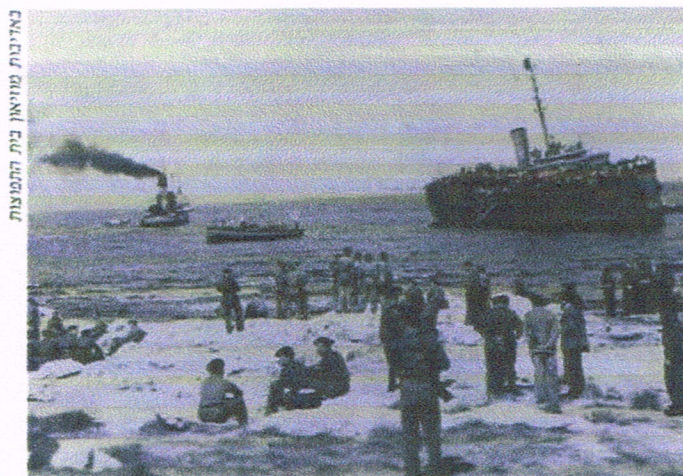
חיילים בריטים ממתניים על החוף להורדת מעפילים מהאונייה - 1947

גם בתום המלחמה, לאחר שתוצאות השואה כבר היו ידועות לכל, המשיכו