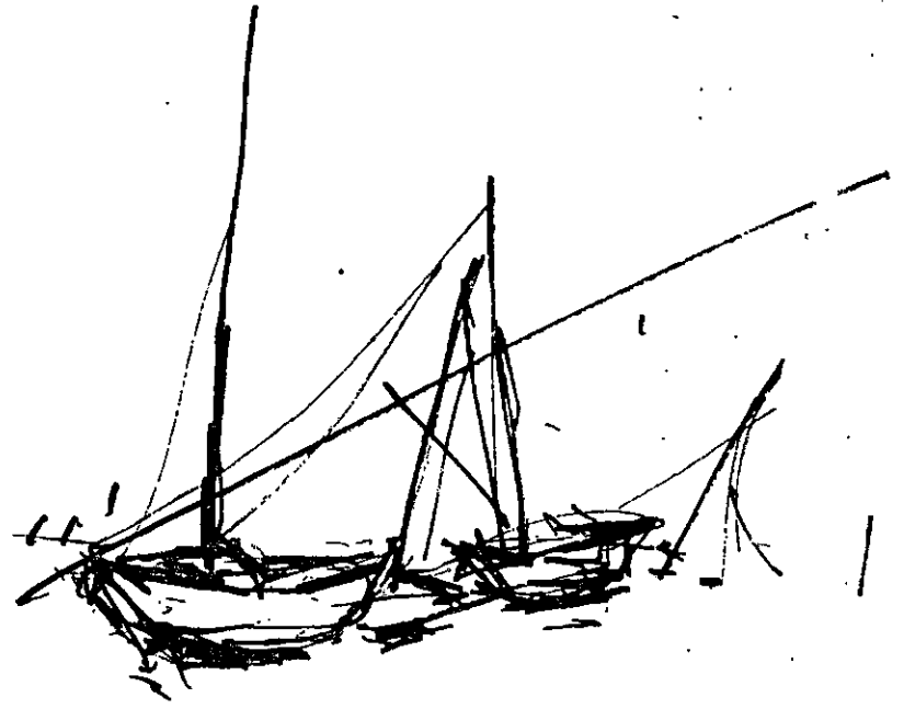
רישום — ארטון צור ז"ל (שער הגולן)

מצד שני, הכריאים, המקריים הקלים יותר, גם הם חושבים שבידי להשפיע ובאים. זה שלושה ימים שאיני יכול לעשות כל עבודה חינוכית, כל עבודה תרבותית, לא עם המורים ולא עם ועדות התרבות. אני עסוק כל הימים בענין הסרטיפיקאטים. אני רוצה שלפחות בין האנשים פה תשרוד קצת שלוה, שהיחס יהייה מעט אנושי, וקשה מאוד להשיג זאת. שמעתי שמדברים כבר על מכות, יש שרוצים להכות אותי מפני שאני סוכן בריטי על אומרי שחי הנערים הבריטיים האלה המסתובבים ליד המחנה, קדושים כחי יהודי. ויש שרוצים להכותני כי אני דואג יותר מדי לכלל ולא לפרט. ויש להיפך שאני עוזר יותר מדי לפרט ושוכח את הכלל. יש אומרים שאני מפלגתי ויש שטוענים מדוע איני עוזר למפלגה שלי. אך אין דאגה, השפעתו על רוב האנשים גורר לה, ונדמה לי שבזמן הקצר להיותי כאן, שרשתי שטויות רבות מליכות אנשים, גם מאלה שבראשונה התנגדו לדבריי.