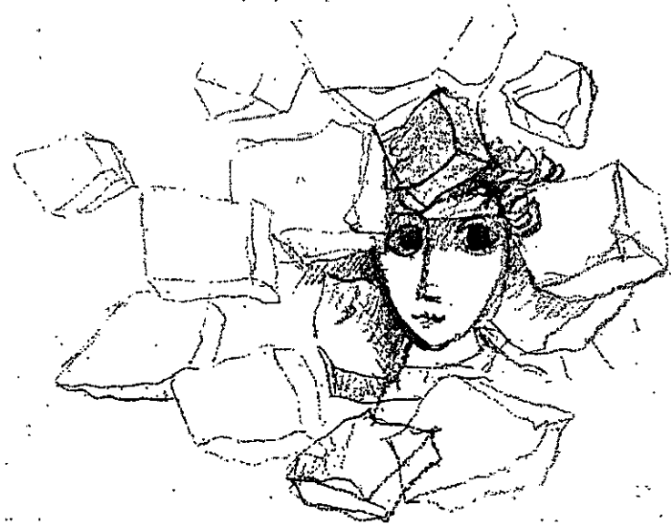
רישום — יוסל ברנר