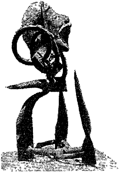
עקה (פסל) — פיני בן סירא (אמיקים)