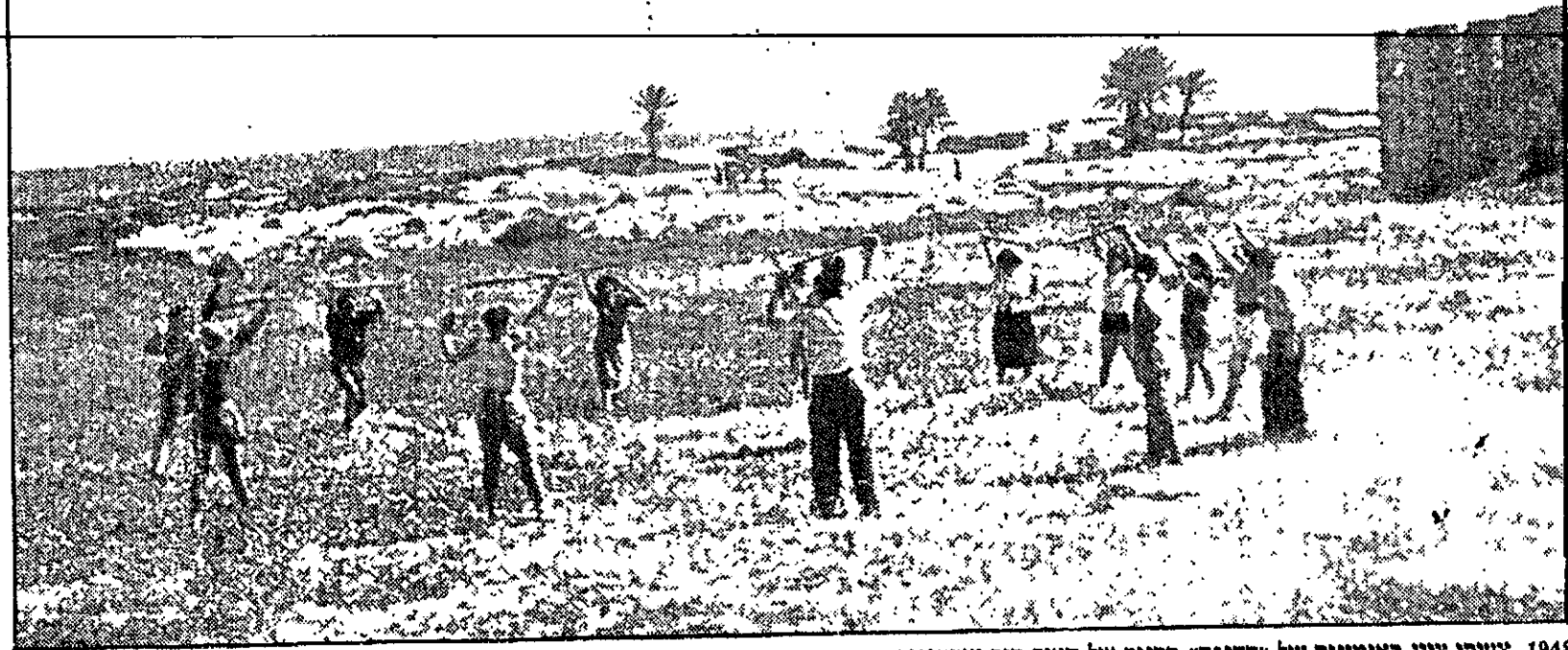
1948. צעירי ציון באימונים של "ההגנה" בסניף של העיר סוס שבתרנים

מעשה חריג, ממש פריצות, בחברה היהודית-צרפתית בתונים של אותם ימים. היה ברור לגוף המייסד של התנועה שעליה לפרוץ גם לעבר אלג'יריה