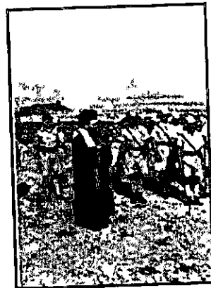
רבים משיבועים חיילים יהודיים בקורפס השני של צבא אנדרס

כאמור, החלה פעולה מאורגנת של כריחה בעיראק, שם חנו עדיין רוב היחידות של הצבא הפולני. אותו זמן פעלה שם שלוחה של "המוסד לעליה ב" אשר הכריחה יהודים לארץ. למטרה זו הסתייעו באנשי "פולל בונה", נהגי "אגד", ובעיקר חיילים של יחידות ארצישראליות בצבא הבריטי אשר עסקו בהובלת שיירות בין עיראק לארץ. השיירות הללו נוצלו להעברת שליחים מהארץ לעיראק ולאיראן, ובשוכן הובדחו בהן חיילים יהודים מצבא אנדרס וכן חברים במתרת החלוצית בכגוד. כמו בן הוברחו כמה מחיילי אנדרס על ידי חיילי היחידות הארצישראליות שיצאו לחופשה בארץ. המוברחים צויידו במדים ובתעודות של הצבא הבריטי. המוברחים התקבלו על ידי אנשי "המוסד לעליה ב" וה"הגנה" באיזור הגבול אשר ליד גשר נהריים, או באשרות-יעקב, ופוזדו במקומות ישוב בארץ. (2).