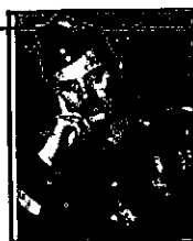
גנרל ולדיסלב אנדרס

בחורש אוגוסט 1941 נחתם הסכם בין ברית המועצות לבין הממשלה הפולנית הגולה בלונדון, כאשר במסגרתו שוחררו כל האזרחים הפולנים וביניהם יהודים, שנכלאו במחנות בבריה"מ לאחר הסכם ריבנטרופ-מולוטוב בין גרמניה הנאצית לבריה"מ.