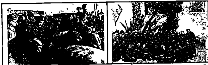
חיילים יהודיים בצבא אנדרס

ההסכם כלל הכרזה על הקמת "צבא פולין החפשי", כראשותו של הגנרל ולדיסלב אנדרס (Wladyslaw Anders) (1). צבא זה עמד להתפנות מתורכיסטאן אשר בבריה"מ אל איזורי המזרח הקרוב אשר בשליטת הבריטים, ומשם להצטרף לחזית הלחימה באירופה מול צבא הרייך הגרמני.