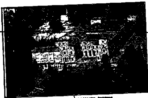
מחנה המעפילים בטורנטו

קבוצת הפעילים עסקה בקדחתנות בהוצאת מזון ממחסנים צבאיים, תחילה ממחסני היחידות העבריות ואחר כך ממחסני מזון כלליים של הצבא, באמצעות תעורות משלוח מזוייפות. המזון שהוצא בדרכים אלו נאגר בהכשרה מגינטה אשר ליד נפולי, ומכאן הועבר בכבוא השעה לספינות המעפילים אשר צוידו לקראת הפלגתן. (3)