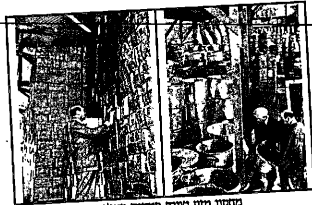
מחסני מזון וציוד במחנה במג'נטה

"בסוף המלחמה פורקה פלוגת התובלה 462. המבוגרים שבחבורה חזרו ארצה ואילו אני וחיללים צעירים אחרים נשארו להמשיך פעילות איסוף הפליטים מרחבי איטליה והעלאתם ארצה. את הרכב החיוני כל כך לפעולתנו 'גייסנו' מהצבא הבריטי. 'החזרנו' את המשאיות של 462 המפורקת לבסיס הצבאי דרך השער הראשי ולאחר שזוכים על המכוניות המוחזרות הברחנו אותן דרך פרצה בגדר. כך הן עברו לרשות ה-T.T.G. לאחר שמחקנו את כל הסמלים והמספרים המזהים שיוכלו להעיד על מקורן. כך גייסנו 50 כלי רכב לחבורה שלנו. כמו כן שימשו משאיות אלו לשינוע אספקה ומזון למחנות, ואספקה לאוניות המעפילים שהעלו את היהודים לארץ." (2)