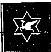
סמל פלוגת תובלה 462

בין כל העוסקים במלאכה התבלטה במיוחד פלוגת תובלה 462, אשר התמקמה לאחר כיבוש איטליה במילנו. מאנשי הפלוגה התגבשה במהלך שנת 1944 ותחילת שנת 1945 קבוצה אשר כונתה "החבורה", אשר נטלה על עצמה לעסוק בהובלת הפליטים ובאיסוף, הובלה ואיחסון ציוד עבורם. (1)