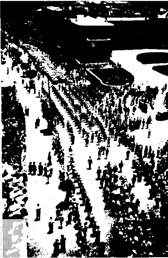
הפגנה נגד 'הספר הלבן' בירושלים

באותו יום כתב הוא 'קוי פעולה' — תכנית מלחמתו ב'ספר הלבן' — שאותם השמיע במסיבת ארגוני הנוער בירושלים שהתקיימה באותו ערב (במרוצאי חג השבועות). הוא טען, כי העם היהודי עומד עתה על סף תקופה חדשה, 'תקופת הציונות הלוחמת... המשך פעולתנו הציונית יתכן אך ורק מתוך מלחמה... נוכל להמשיך את פעולתנו וגם נגביר ונחיש אותה, אך ורק מתוך מלחמה גלויה ונועזת שלא תרתע מכל מכשול וסכנה'. אין זו מלחמה נגד העם האנגלי והאימפריה הבריטית, אלא 'מלחמה במדיניותה של הממשלה האנגלית'. מטרת המלחמה אינה השגת העצמאות בשביל יהודי ארץ-ישראל,