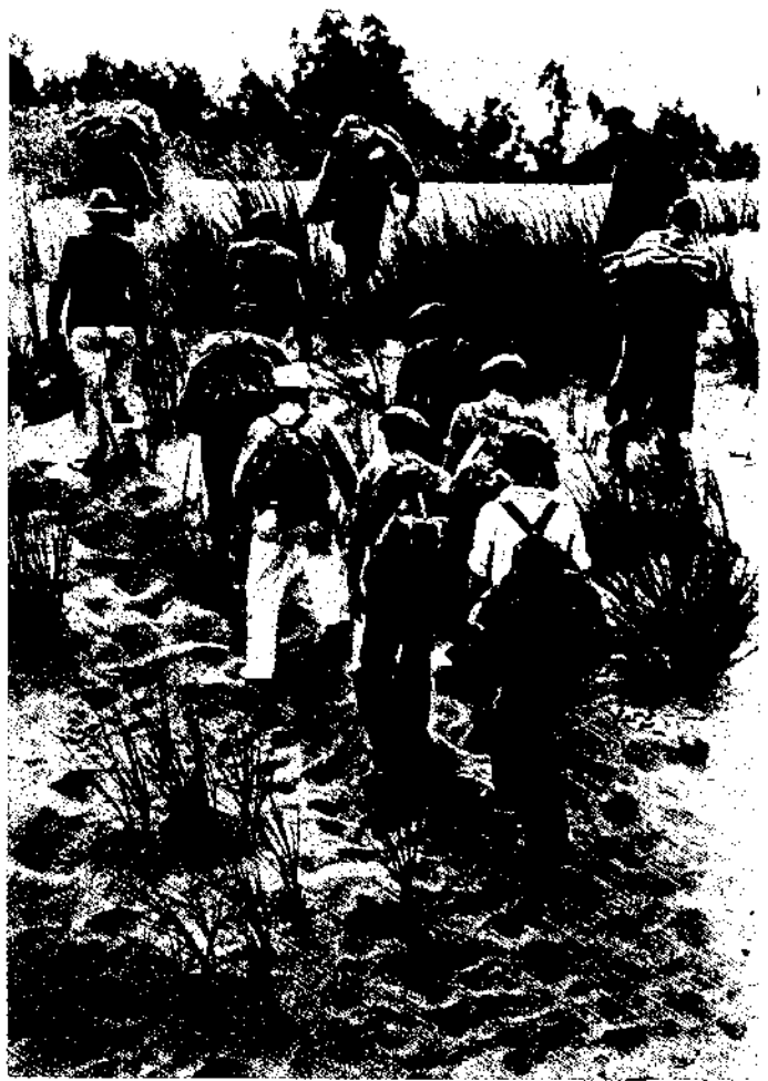
עולים בלתי-לגאליים בדרכם לחוף, 1939

היהודי, זאת בדיוק בשעה שכה היו זקוקים לארגן פעולות-הצלה המוניות ומיידיות ליהודי אירופה ובייחוד ליהודי גרמניה ואוסטריה.