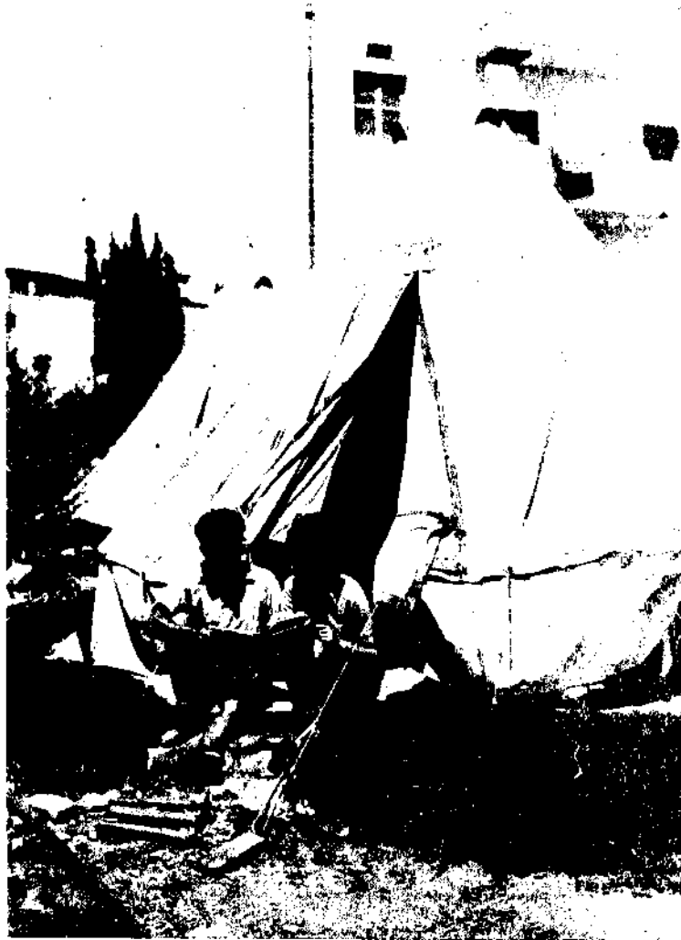
במחנה עולים בלטר- לגאליים בגבעת מיכאל שליד נס־ציונה, 1939

אוניות. 97 בישיבת הנהלת הסוכנות היהודית שהתקיימה ב־5 ביוני 1939, התקבלה החלטה על עריכת מגבית מיוחדת לצורכי עלייה בארץ ובגולה, ועל מתן הלוואה של 25,000 ליש"ט על חשבון ההכנסות. 98 אולם כבר בישיבת ההנהלה שהתקיימה ב־11 ביוני הודיע בן־גוריון, כי קיבל מאליעזר קפלן, גזבר הסוכנות היהודית, ששהה אותה עת בחוץ־לארץ, תשובה שלילית בעניין הלוואה. באותה ישיבה הוחלט להטיל על הוועדה שהורכבה במיוחד לצורך זה, לברר את שאלת גיוס הכספים על־מנת להביא הצעות מעשיות להנהלה בישיבתה הקרובה. 99 בוועדה מסר ד' בהרל, מנהל מחלקת הכספים של הסוכנות, סקירה על המצב הכספי, לפיה יגיע גרעון התקציב הרגיל של הסוכנות לכ־60 אלף לא"י. לכן הוא לא ראה כל אפשרות להעמיס עוד הוצאות על חשבון תקציב זה. דובקין הציע, בניגוד לדעתו של קפלן, להקציב 20,000 לא"י, ובן־גוריון הציע לזקוף הסכום לחשבון התקציב לשנת ת"ש. בישיבת הנהלת הסוכנות שהתקיימה ב־13 ביוני 1939, הוחלט אמנם להטיל על הגזברות להשיג הלוואה של 20,000 לא"י לצורכי עלייה. 100 בן־גוריון הסכים להלוות