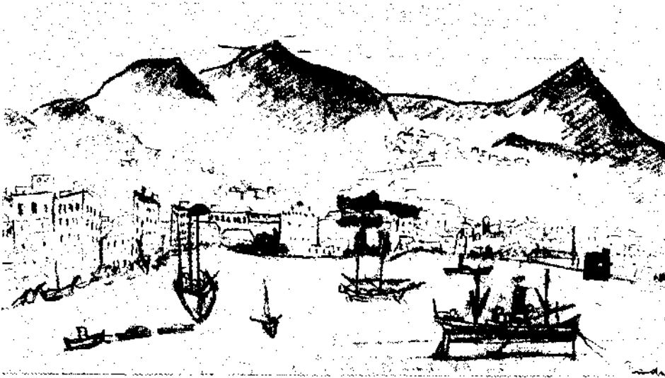
ספינת המעפילים 'גלוס', בשהותה בנמל סלונקי - רישום מתוך יומנו של אליקום (פנידה) שפע

בישיבת הנהלת הסוכנות היהודית שהתקיימה בפברואר 1936, דיבר בן-גוריון, יושב-ראש ההנהלה הציונית, על עניין הגאליזאציה לעולים שהסתגנו ארצה מאז שנת 1931 כעל הונגרות בין ענייני הפרט - העולים הבלתי-גאליים המצויים בארץ - וענייני הכלל - היהודים בחוץ-לארץ המחכים לתורם לעלייה ארצה. הוא סבר, שהנהלת הסוכנות היהודית צריכה לדרוש את טובת הכלל, וכי אין להקציב רשיונות לעולים הבלתי-גאליים המצויים כבר בארץ; אסור לשחרר את הממשלה מהדאגה הזאת, היא ניכחה מהשריולים [מכסות-עלייה] בתור קנס כער הבלתי-גאליים יותר מ-6000 רשיונות, ואין זה נכון מצידה גם לנכות את הרשיונות וגם למנוע את אישורם. 6 בן-גוריון סבר, כי עדיין לא מוצו כל האפשרויות, ולא נעשו כל המאמצים; העניין טרם הובא לפני הממשלה בלונדון וכפני ועדת המנדטים של חבר הלאומים. לא הופעלו מספיק לחצים על השלטונות וגם לא הופעלו כל הגורמים הציבוריים.