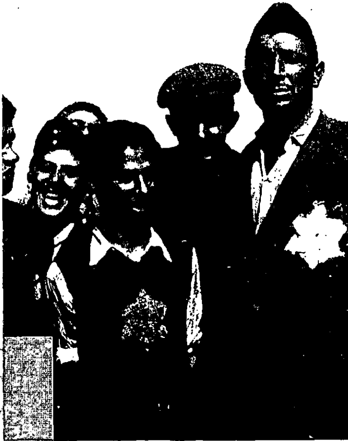
ניצולי שואה במחנה המעפילים בעתלית

השואה, יהודי ארצות האסלאם, ארצות-הברית ואירופה המערבית לפעול בצוותא. גיוס מלא של כל חלקי העם ייצור ריכוז של כוח, שיוכל להפעיל את הלחץ המדיני המוסרי הנדרש על הממשלות הנוגעות בדבר. ניצולי ההשמדה, יהודים במצוקה ויהודי ארצות החופש — כולם יחדיו היו בהשקפתו של בן-גוריון 'שארית הפליטה' של העם היהודי. הוא השתמש במושג זה בדרך המסורתית היהודית, המבטאת את הקשר שבין החורבן והגאולה. אך בניגוד לרוב חבריו, שראו בניצולי השואה את שארית הפליטה, חשב בן-גוריון שהעם היהודי כולו הוא השארית. כל הציבור שמנה מיליוני יהודים, היה זקוק להצלה, והצלתו אפשרית רק על-ידי שינוי מעמדה המדיני של הציונות. אם תשכיל המדיניות הציונית להפוך את שארית הפליטה לגורם בעל משקל בשיקולים המדיניים של המעצמות, יבוא, לדעתו, השינוי המיוחל. שילוב מצוקתם של ניצולי השואה עם היכולת והנכונות של הציונות לעזור להם, ושיתופן של הקהילות היהודיות האחרות במתקפה מדינית על דעת-הקהל בארצות הדמוקרטיות יביאו להגשמת התכנית הציונית. עיקר ראשון בהשקפתו היה העלאתם לאלתר של הניצולים לארץ, ולא השתתפותם המיידית והמלאה בהתיישבות ובבניין הארץ. שיכונם במחנות ארעיים בארץ ותכנית לשיקום חייהם בה היו מדגימים את עוצמתם המוסרית של הציונות והיישוב גם כשלהי המלחמה ולאחר שהמעצמות לא הראו נכונות לעזור ליהודים, האמין בן-גוריון שלצדקתה של הציונות נודעה חשיבות בשיקולי המעצמות לאחר המלחמה.