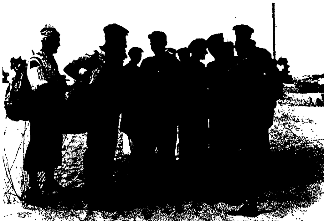
עולים שנחתו על החוף באופן בלתי-לגאלי מתרכזים סמוך לגבעת- מיכאל (מצפון לנס- ציונה), אוקטובר 1939

בפני כליון גופני. שאלת הפליטים נעשתה עכשיו שאלה עולמית ושאלה דוחקת ואנגליה מתאמצת להפריד עכשיו בין שאלת הפליטים לשאלת ארץ ישראל. ההיקף האיום של בעיות הפליטים מחייב פיתרון טריטוריאלי, ופתרון מהיר ואם ארץ ישראל אינה קולטת מוכרחים למצוא טריטוריות אחרות. והציונות עומדת עכשיו בסכנה... לא עלייה מצומצמת לא עלייה רחבה, דרושה לנו עלייה המונית עליה של מאות אלפים... בלי עלייה גדולה הציונות עלולה לרדת מעל הפרק ואנו עלולים להפסיד את הארץ... לא מלחמה על עלייה, אלא על ידי עלייה, מרד עלייה (ההרגשות במקור). 21