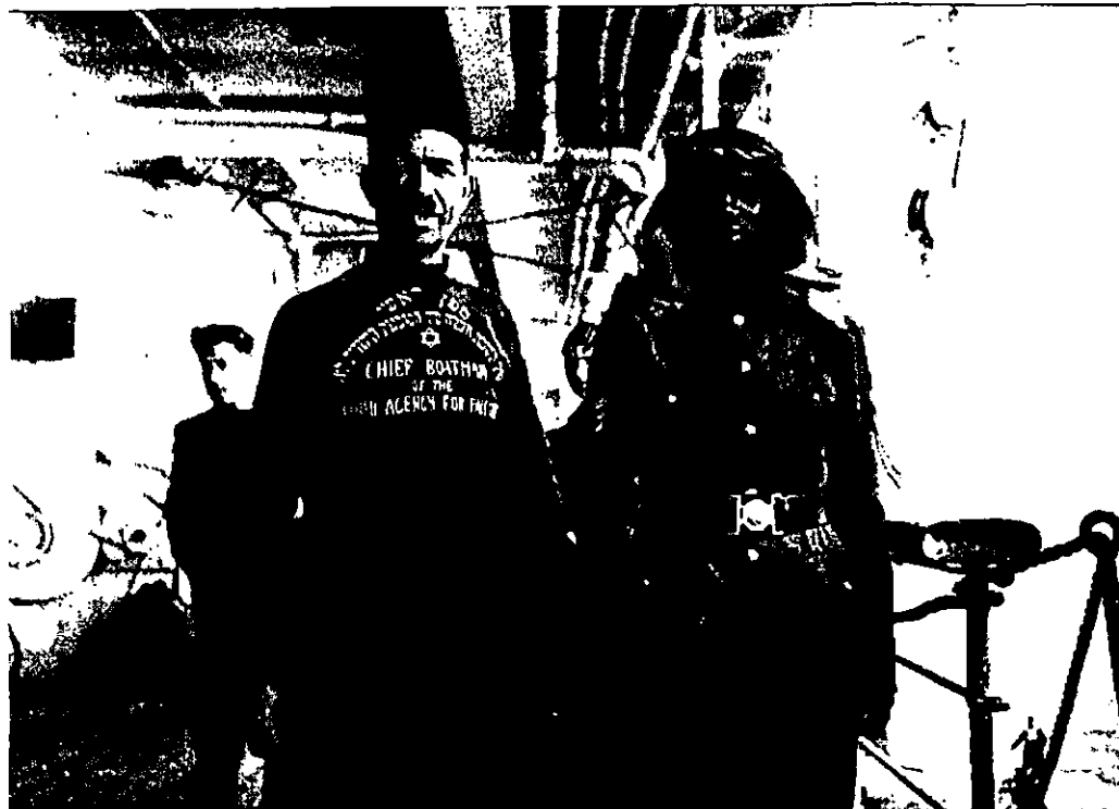
ספן ראשי של לשכת העלייה של הסוכנות היהודית לא"י ושוטר ערבי, מפקחים על ירידת עולים ביפו, נובמבר 1933

בעקבות ההחרפה במצוקת יהודי אירופה גברו הלחץ על המשרדים הארץ-ישראליים והצורך להרחיב את מעגל המשתתפים בפועל בהגשמה הציונית. אף-על-פי ששימש מזכיר ההסתדרות והיה ער במיוחד לבעיות העלייה בתנועת 'החלוץ', לא חיפש בן-גוריון את העולים מקרב תנועות הנוער ומקורבי תנועת הפועלים בלבד. בשיחה עם שליחי ההסתדרות ומנהיגי הנוער שהתקיימה בוורשה באביב 1933, שמע על הגידול הרב בתנועת 'החלוץ', שמנתה (כפי שדיווחו החברים) כחמישים אלף חבר, מהם כחמישים (11,000) בהכשרות. הוא לא נטש את העקרון, שיש לבחור בקפידה את העולים לארץ, גם אם הם חברי 'החלוץ', והתנגד להצגת העלייה החופשית והבלתי-מבוקרת גם כתעמולת בחירות. בדבריו בכינוס מפלגתו שנערך ב-29 בנובמבר 1932, החיל את המושג 'חלוץ' למי שמוכן היה לבוא לארץ ולהעניק לה מכוחו, ולא רק על מי שהוכשר בתנועה חלוצית לקראת ההגשמה. כל מי שחיפש חיים יוצרים ולא פילנטרופיה היה, לדעתו, שותף להגשמה הראויה של הציונות. בן-גוריון, חיפש תשובה לשאלה, 'מי הם האלמנטים היכולים להתיישב בארץ ישראל', וכיצד ניתן 'להציע התישבות לאומית בריאה לא רק של חלוצים כי אם של חוגים אחרים...'. הוא רצה בעלייתם של מי שכונה 'חלוצי ההון', שיביאו לארץ את כל מאורם ורכושם. בן-גוריון לא היה היחיד וגם לא הראשון שביטא עמדה זו בתנועה הציונית או בתנועת הפועלים; הוא הלך בעקבות רופין וארלוזורוב, שהתעמקו בשאלות של מימוש האפשרויות החדשות שהמציאות הגרמנית זימנה להגשמה הציונית. עם זאת, הניסוח של קונקרטי יותר ומתייחס לעמדות ברורות של תנועת העבודה, שחייבה בעיקר עלייה של חלוצים. 9 הרחבת המשתתפים במעגל ההגשמה הציונית היה רק מרכיב אחד שהשתנה בגישתו של בן-