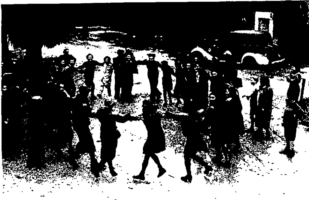
ילדים מהונגריה שהגיעו במסגרת עליית הנער לחיפה במהלך מלחמת העולם, 19 בינואר 1943