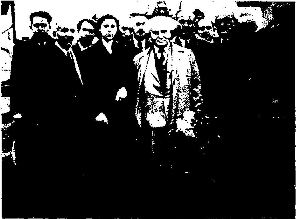
בן-גוריון מבקר אצל יהודי בולגריה, 1 בדצמבר 1944

של התבוללות זו היא הסגרה לקומוניזם... המסקנה העיקרית שלי היא לציונות יש פרובלימה אחת — הצלת שארית היהודים בחדשים או בשנים הקרובות, אני אומר או, כי אני בטוח אם השארית תתקיים במשך השנים, הגזיינט אינו פעיל שם, ואני חרד לסכנה אם החידקים של הקומוניסטים יתאחדו עם הגזיינט. 31