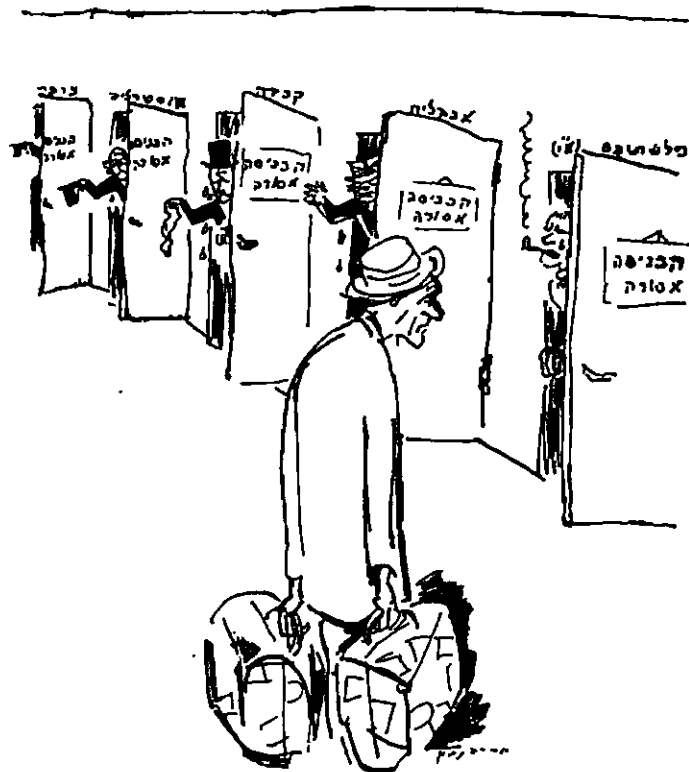
נעילה בותעידת אוויאן, קריקטורה של אריה נבון, 1939

העלייה היתה החוליה המחברת בין כל הגורמים שהזכרנו. הניצולים שיגיעו לארץ, גם אם יזדקקו לפרק-זמן מסוים בטרם יתחילו את חייהם החדשים, יהפכו את המשימה הזו למכנה משותף של העם היהודי כולו. בגולה תיווצר מנהיגות, שתפקידה יהיה לארגן וליזום את תנועת העלייה, בעזרתם של שליחי היישוב. מנהיגות זו, מבין ניצולי השואה, תוכל להרחיב את מעגל הציבור המעורב על-ידי פעילות ארגונית וחינוכית בקרב הקבוצות השונות המיועדות לעלייה. העלייה תאפשר ליהודים שחיו בקהילות החופשיות, ובעיקר בארצות-הברית, לתרום את חלקם לשיקום הניצולים, לא במחנות באירופה, אלא בארץ-ישראל. בכך תקשור אותם באופן בלתי-אמצעי לבניין הארץ. ארגון העלייה יהפוך את היישוב לפעיל באופן ישיר בהצלת שארית הפליטה, וייצור את שיתוף הפעולה ההכרחי בין היישוב לבין העולים והגולה. ולבסוף, העלייה תחייב את המעצמות להירתם לתמיכה בציונות, משום שלא תוכלנה להתחמק מן האחריות המוטלת עליהן לעשות לשיקומם של יהודי אירופה שניצלן. 27