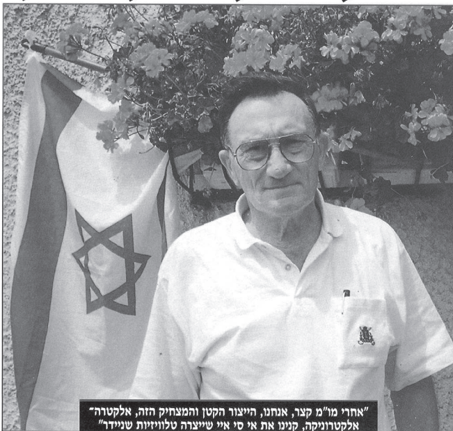
"אחרי מו"מ קצר, אנחנו, הייצור הקטן והמצחיק הזה, אלקטרה" אלקטרוניקה, קנינו את אי סי איי שייצרה טלוויזיות שניידר"

מלחמת העצמאות של אברהם גולדשטיין סוז סובלי ואיזה מביקוב אמרות מעופפות לא מעודת בני שוק התקשורת השולגי איר לוחמים לדיוח יצירתי