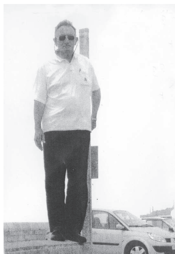
בנמל סט בצרפת: שישים שנה אחרי, 12 ביולי 2007, במהלך צילום הסרט