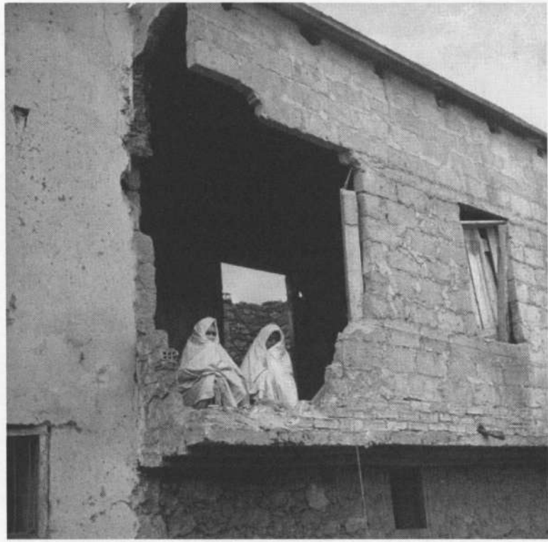
הריסות בית לאחר הפגזה של בעלות הברית, קובלנקה, מרוקו, 1942.