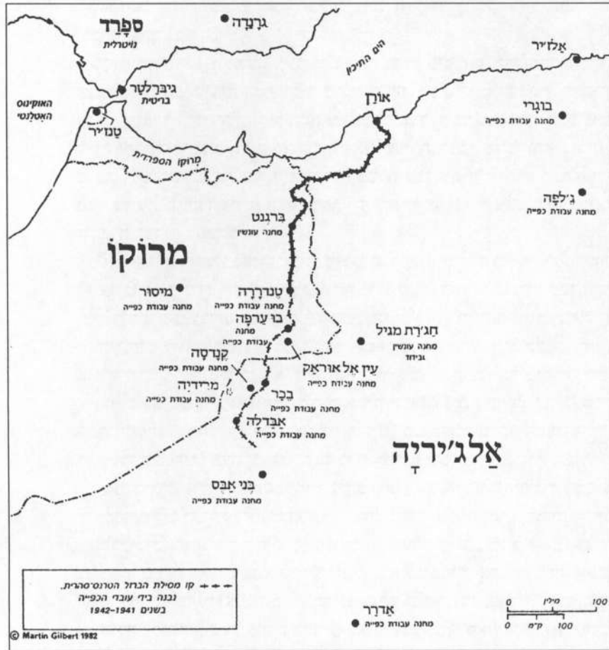
מחנות עבודת כפייה בסהרה 1941-1942.