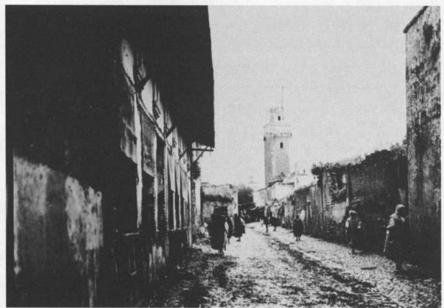
המלאח בפאס, מרוקו, 1930 בקירוב.