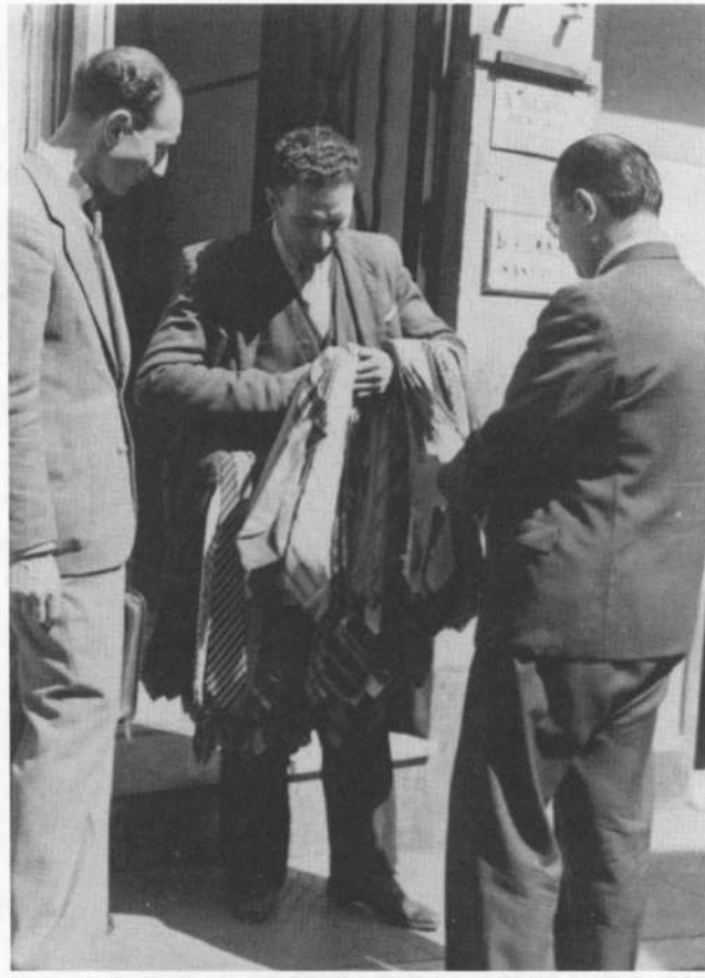
פליט יהודי מתפרנס ממכירת עניבות שרכש בכספי מענק שקיבל מארגון ה'ג'וינט', טנג'יר, מרוקו, 1944.