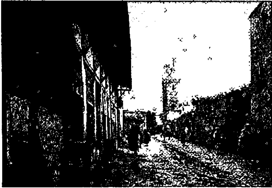
המלאח במאט, מרוקו, צלם לא ידוע, 1930 בקירוב. אוסף ז'אק לוי, באדיבות מוזיאון ישראל