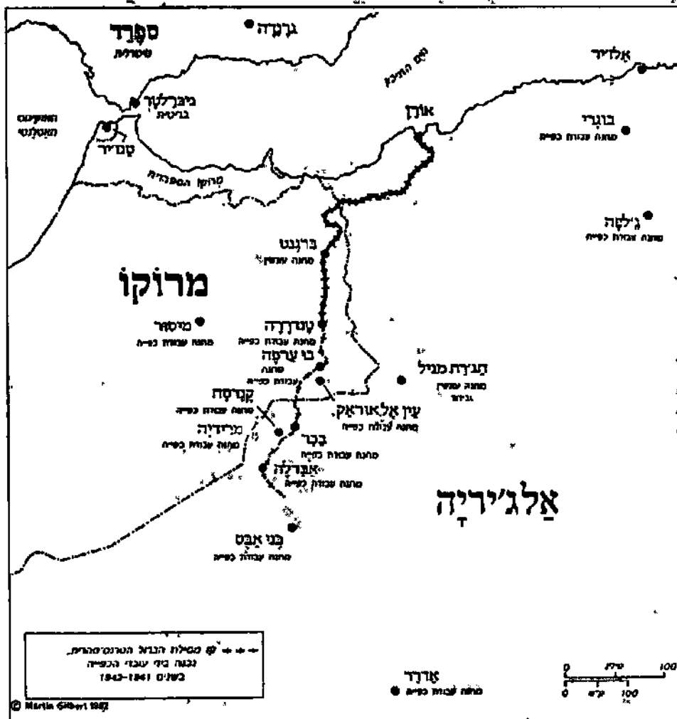
מחנות עבדול כפיה בטהרה 1941-1942.