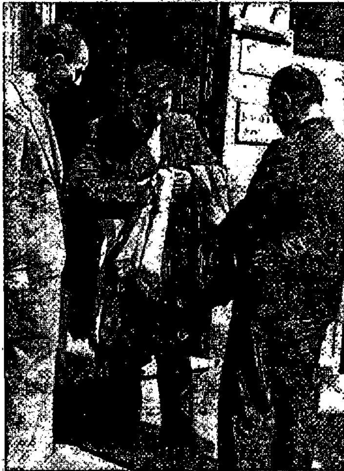
פליט יהודי מתפרנס ממכירת עניבות שרכש בכספי מענק שקיבל מארגון הציונים, טנג'יר, מרוקו, 1944.