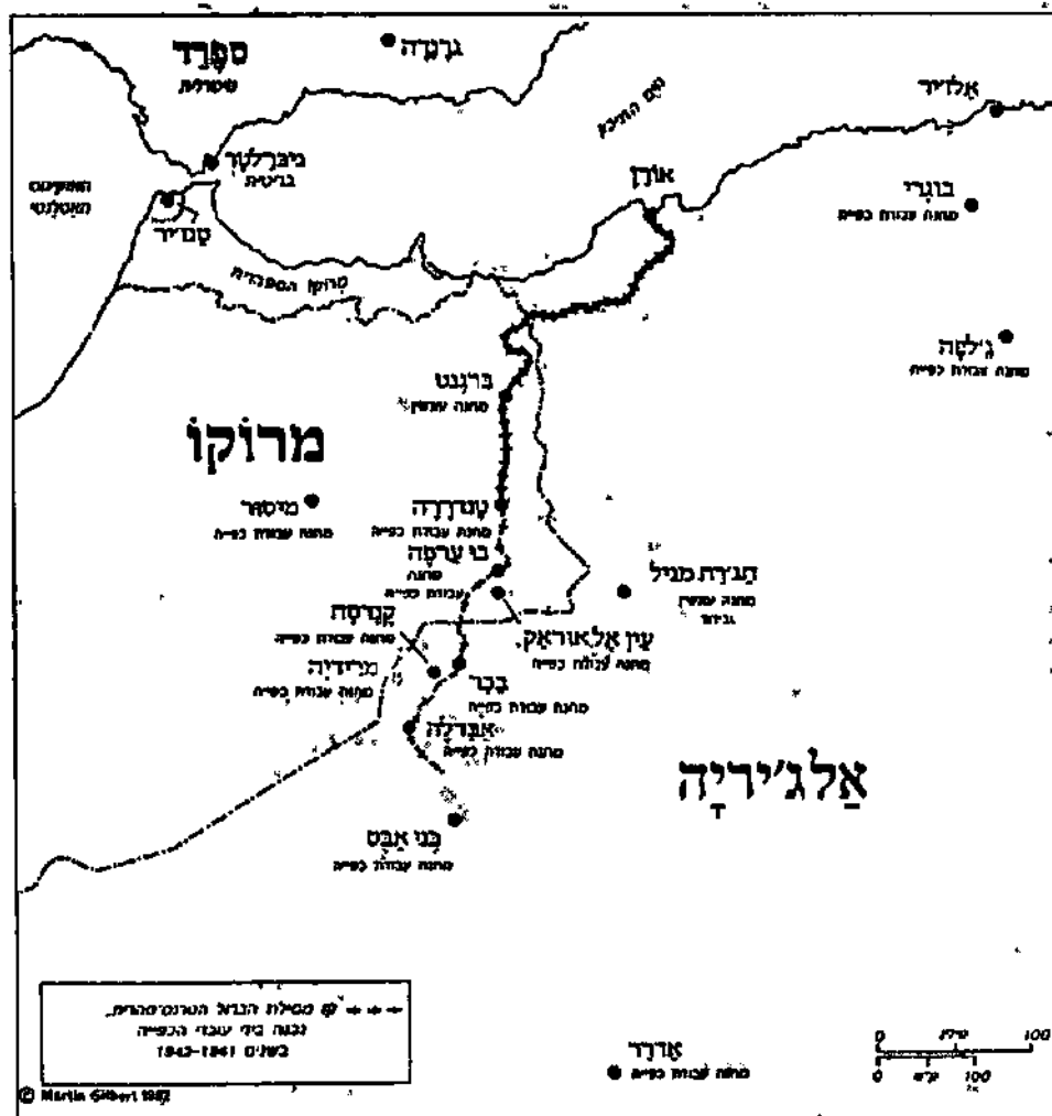
מחנות עבודת כפייה ביהודה בשנת 1942-1941. בארצות מרצין גילברט