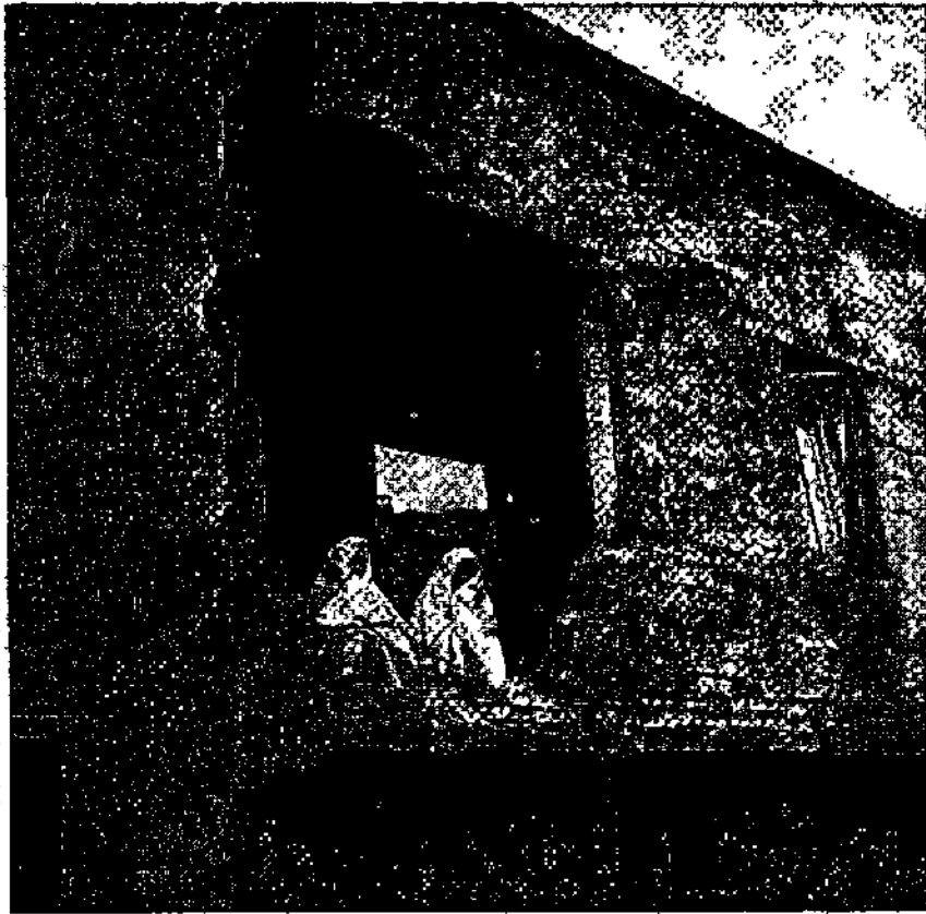
הריסות בית לאחר הפגזה של בעלות הברית, קובלנקה, מרוקו, 1942.