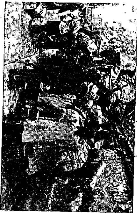
בין גבולות וזרכים

א. על יהדות הנגרה מסמכים היסטוריים ספקים על הימצאותם של יהודים בהנגרה עד בטרם היו ההנגרים לעם. ביסדה/התחוותה הזוהי זו ע"י הגירה גדולה ממורבת ומפולין; כן ברור כי האל מן/למחצית השניה של המאה ה-11 קיימת התחשבות יהודית בחלקים שונים של הנגרה וכבר בשנת 1092 פורסמו איטורים משעם הכנסיה נגד היהודים. במקופת לפיבש השטרקי היה מצבם של היהודים טוב