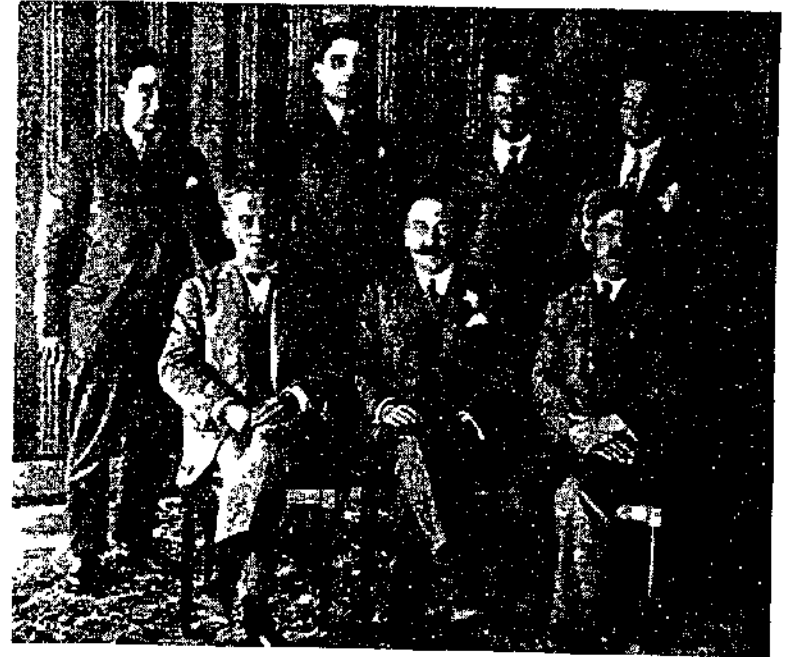
מייסרי L'Avenir Illustré 1926. עומד שני משמאל יתחן טורש