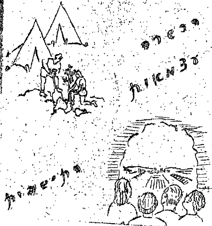
שער "נתנו" - עלון הגרעין הצפון-אפריקאי בבית אורן ואח"כ בבית השטה.