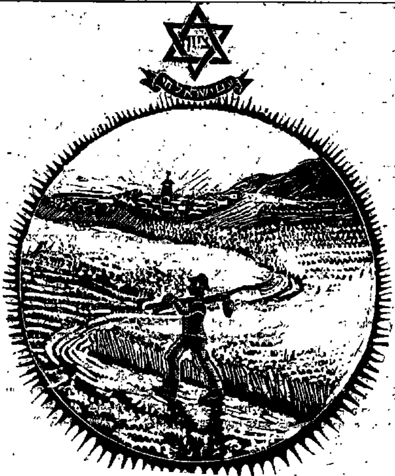
שער "נתנו" - עלון הגרעין הצפון-אפריקאי בבית השטה.