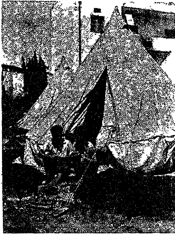
כמתנה עולים בלתי- לגאלים בגבעת מיכאל שליד נט-צינה, 1939

אוניות. 97 בישיבת הנהלת הסוכנות היהודית שהתקיימה ב-5 ביוני 1939, התקבלה החלטה על עריכת מגביית מיוחדת לצורכי עלייה בארץ ובגולה, ועל מתן הלוואה של 25,000 ליש"ט על חשבון ההכנסות. 98 אולם כבר בישיבת ההנהלה שהתקיימה ב-11 ביוני הודיע בן-גוריון, כי קיבל מאליעזר קפלן, גזבר הסוכנות היהודית, ששהה אותה עת בחוץ-לארץ, תשובה שלילית בעניין ההלחאה. באותה ישיבה הוחלט להטיל על הוועדה שהורכבה במיוחד לצורך זה, לבודר את שאלת גיוס הכספים על-מנת להביא הצעות מעשיות להנהלה בישיבתה הקרובה. 99 בוועדה מסר ר' בהרל, מנהל מחלקת הכספים של הסוכנות, סקירה על המצב הכספי, לפיה יגיע גרעון התקציב הרגיל של הסוכנות לכ-60 אלף לא"י. לכן הוא לא ראה כל אפשרות להעמיס עוד הוצאות על חשבון תקציב זה. דובקין הציע, בניגוד לרצונו של קפלן, להקציב 20,000 לא"י, ובן-גוריון הציע לזקוף הסכום לחשבון התקציב לשנת ח"ש. בישיבת הנהלת הסוכנות שהתקיימה ב-13 ביולי 1939, הוחלט אמנם להטיל על הגזכרוח להשיג הלוואה של 20,000 לא"י לצורכי עלייה. 100 בן-גוריון הסכים להלוות