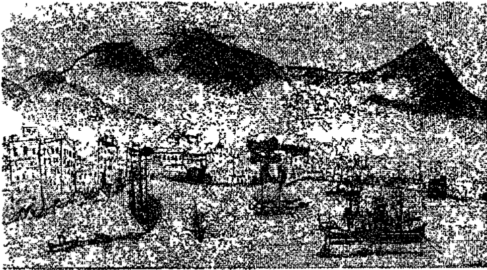
ספנות המעפילים 'לוסי', בשדהותה בגמל סלונקי — רישוט מתוך יומנו של אליקום ('פינרדה') שמע

בישיבת הנהלת הסוכנות היהודית שהתקיימה בפברואר 1936, דיכר בן-גוריון, יושב-ראש ההנהלה הציונית, על עניין הלגאליזאציה לעולים שהסתננו ארצה מאז שנת 1931 כצל התנגשות בין ענייני הפרט — העולים הכלתי-לגאליים המצויים בארץ — וענייני הכלל — היהודים בחוץ-לארץ המחכים לתגום לעלייה ארצה. הוא סבר, שהנהלת הסוכנות היהודית צריכה לדרוש את טובת הכלל, וכי אין להקציב רשיונות לעולים הכלתי-לגאליים המצויים כבר בארץ; אסור 'לשחרר את הממשלה מהדאגה הזאת, היא ניכתה מהשריוולים [מכסות-עלייה] בתור קנס בעד הבלתי לגאליים יותר מ-6000 רשיונות, ואין זה נכון מצידה גם לגבות את הרשיונות וגם למנוע את אישורם'. 6 בן-גוריון סבר, כי עדיין לא מצאו כל האפשרויות, ולא נעשו כל המאמצים; העניין טרם הובא בפני הממשלה בלונדון וכפני ועדת המנדטים של חבר הלאומים. לא הופעלו מספיק לתצים על השלטונות וגם לא הופעלו כל הגורמים הציבוריים.