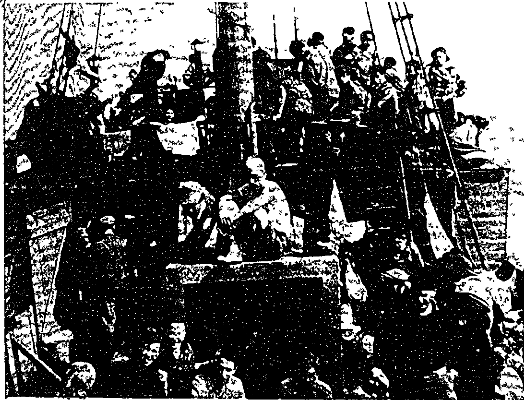
על סיפונה של 'נחשון הקטל' - אביב 1948

הרוח הציונית במהגות הנידחים באירופה וביהדות העולם; אלמלא היא, מי יודע אם לא היו נופלים ברוחם, נואשים ומתפורים פיזור פיסה והופכים לאבק-אדם מבחינה לאומית ואנושית. באותה התקופה השתורה היתה ההעפלה מחזקת בתמידות את רוחו של היישוב במאבקו. היתה להעפלה ערך גם מבחינת העלייה? ההרפתה למעשה את מספר העולים? דין ודברים ארוך התנהל בעניין זה בציבוריות ובעיתונות הציונית והיהודית. המספרים הבאים יענו את תשובתם הניצחת. אך כבר אמרתי לעיל, שאין זו רק שאלה מספרית של כך וכך רבבות, שעלו בדרך ההעפלה ואחרת לא היו מגיעים ארצה. ברור לגמרי, שאלמלא לחץ-ההעפלה לא היו נפתחות לפנינו גם אותן האפשרויות הליגאליות שנפתחו. ומי שיעין בתולדות ההעפלה יראה זאת עין בעין. ואשר לשלטון, לא היתה תפארתו במלחמתו בהעפלה. בכל נפתוליו אתו נאלץ לסגת צעד אחר צעד לאחור כל התקפה שניסה להתקיף. אולי לא היה בכך משום ניצחון להעפלה, אבל היתה בכך משום נסיגה מתמדת לשלטון ומפלה מעשיה ומוסרית, לרוב גלויה לעולם. הנה הכרזת הספר הלבן (מאי 1939) שכתתום 75,000 הסרטיפיקטים שהוקצבו על-ידי הספר הלבן לא יוסיפו היהודים לעלות אלא בהסבתם של הערבים — והממשלה הבריטית נאלצה להתיר עלייה של 1,500 נפש לחודש גם לאחר תום המבסה הנ"ל. לגבי מגורשי מאוריציוס היתה הודעה מפורשת, שאלה ישולחו למושבה בריטית... ובסוף המלחמה יוחלט להיבן יישהו — — — אך אין ברעת הממשלה שיבואו לארצנו — — — וסופם של מגורשי מאוריציוס, שלאחר סבל אין קץ וקרבות הגיעו ארצה.