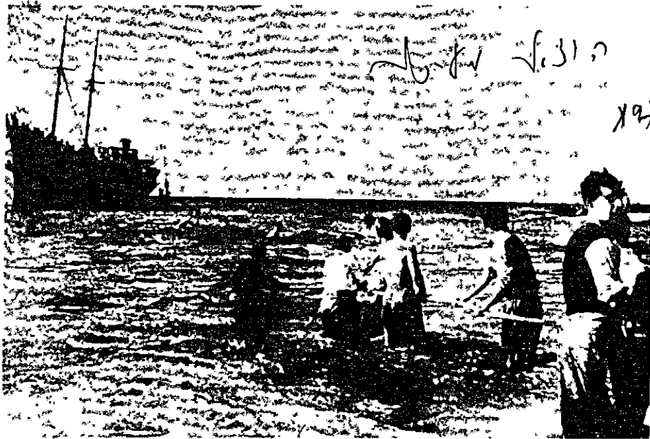
אחת הספינות שפרצו את המצור - 'האומנת המאוחדות' בחוף נהריה

32 זה העמוק ביותר של ההעפלה הוא היותה נעוצה בעיקרה בצרכים הפנימיים - בחוקים 33 ים של ההווה היהודית. הנסיבות החיצוניות עלולות רק לסייע או לעכב. ההעפלה היא אולי