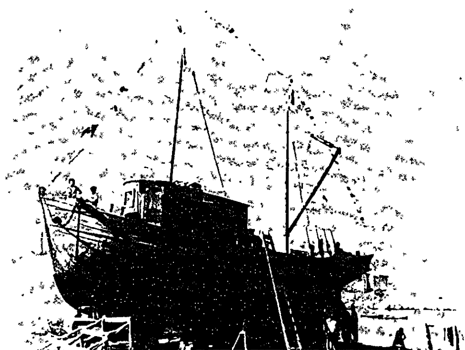
הקטנה ביותר (יודליון) — 35 מעפילים; הגדולה ביותר (יפאן קרשנט) — 7500

כלי-השיט היו, כמובן, מגודל שונה. הכלי הקטן ביותר של 'המוסד לעלייה' ('דליון) הביא לחופי ארץ 35 מעפילים. כלי-השיט הגדולים ביותר — 'קיבוץ גלויות' ו'עצמאות' נשאו למעלה מ-7500 נפילים הבל. בן כלי-השיט שהושטו עליידי סוכנים פרטיים היו גם כלי-שיט קטנים מידליון הניל. כמובן, אם נשווה את אשר נעשה בשטח ההעפלה למה שהיה נחוצ, ואולי הכרחי, לעשותו מבחינת