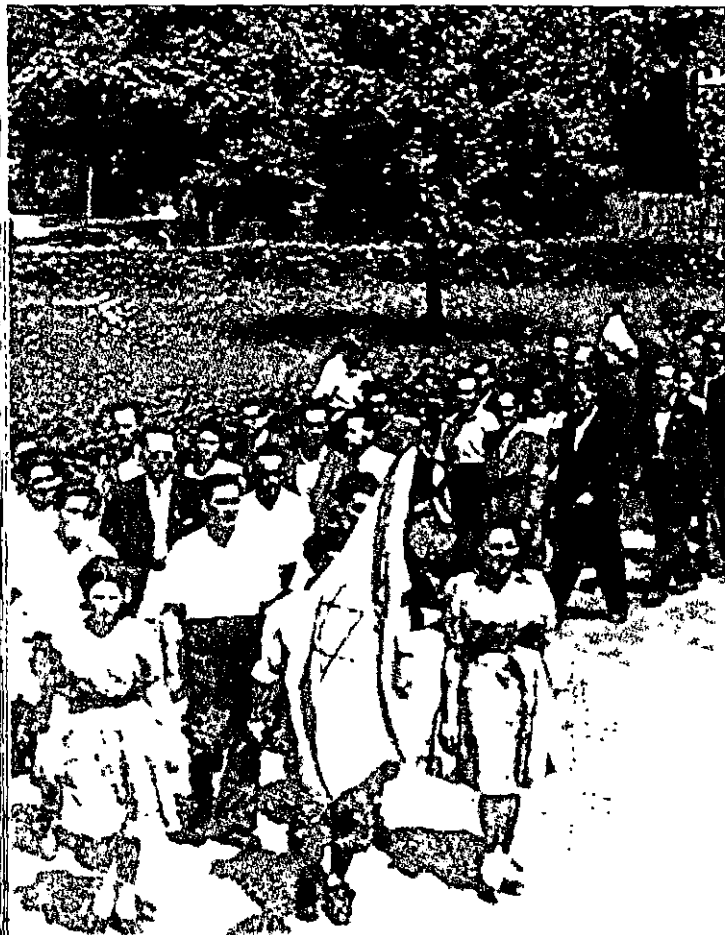
מצעד לרגל הכרזת המדינה, מחנה לאנדסברג, מאי 1948

השליחים באו למחנות לא רק למען סיוע לניצולים, אלא גם עם תפקיד מוגדר מראש: לשכנעם ללכת בדרך הצינונית ולחזקם בדרך להגשמת ההתלטה הזאת למרות כל הקשיים. השליחים היו מודעים היטב לקשיים הצפויים לניצולים בארץ, פיסיים ומנטאליים כאחד, וכמו-כן היו ערים לצרכים שדורש המאבק מבני הארץ כולם. לכן תששו מאוד מפני אי התאמה של הניצולים למאבק זה, שמבתינתם חשיבותו האפילה על הכל. תששות אלה גרמו להם לבתון את הניצולים בעיניים ביקורתיות ביותר, ואצל רבים מהם התפתח דימוי נמוך, לעתים אפילו שלילי, של הניצולים. מובן שזוהי הכללה, והיו שליחים לא מעטים שהיה להם דימוי חיובי ביותר של הניצולים, אולם זו תופעה שהתקיימה במחנות, ולא מעט. צורכי הקליטה השפיעו על תדמית הניצולים בקרב השליחים בשני הכיוונים: מצד אחד, כאמור,