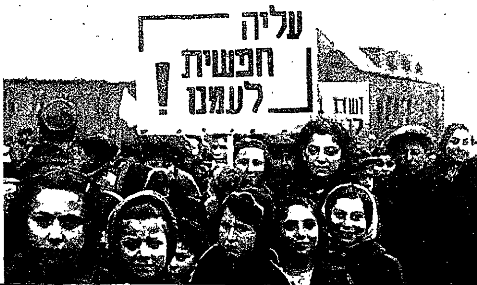
הפגנה למען עלייה חופשית לארץ-ישראל באחד ממחנות העקורים, 1947 בקירוב

בסופו של דבר הוכרעה השאלה בידי הניצולים עצמם על-ידי "הבתירה ברגליים". מן הנתונים המספריים עולה, ש-70 אחוזים מיהודי המחנות בין השנים 1946-1951 עלו לארץ-ישראל (152 אלף בקירוב), לעומת 30 אחוזים שהיגרו לארצות הברית, קנדה וארצות אחרות (כ-66 אלף). משפרצה מלחמת העצמאות התמיסו כ-8,000 איש לכוחות ההגנה ולצה"ל; כ-80 אחוזים מהמועמדים הפוטנציאליים לגיוס התנדבו לסייע לכוחות הלוחמים בארץ, משום שראו עצמם חלק ממנה עוד בטרם דרכה בה כף רגלם. בסופו של דבר, יהיו מניעיו אשר יהיו, הרעיון הציוני היה הכוח המרכזי בחייה של שארית הפליטה במחנות העקורים, והשפעתו ניכרה בכל תתומי החיים בהם. הצירוף התד-פעמי של אמונתם האידיאולוגית של אותם ניצולים שהיו ציונים עוד טרם המלחמה עם אמונתם הספונטאנית של ההמונים במחנות ועם הפעילות הציונית של השליחים, ושל החיילים העברים לפנייהם - הצירוף הזה נטע בניצולים נחישות אידיאולוגית בעלת עוצמה והביא להשתלבותם הטבעית, מתוך בחירה, במאבק הציוני על כל היבטיו.