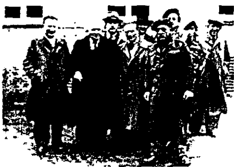
דוד בן-גוריון בביקור במחנה העקורים בברגן-בלזן, 1945

להערכת, מרבית יושביהם של מחנות העקורים בגרמניה קיבלו על עצמם מרצון את גיוסם למאבק הציוני והם שבתרו להיות שותפים בו, כפי שבחרו. גם לעלות ארצה. אין משתמע מכך שלא היו גם בעלי רצונות אחרים, ואף אין משתמע מכך שלא הופעל לחץ חברתי, הן בידי השליחים והן בידי הניצולים עצמם, על אלה שרצו אחרת.