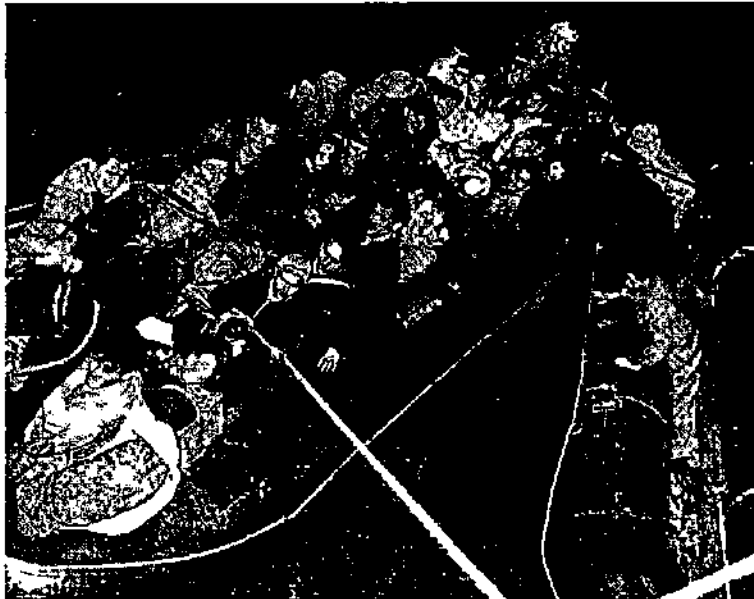
מעפילים בסירות גומי גוררים עצמם בעזרת חבלים לעבר הספינה הממתינה בהם