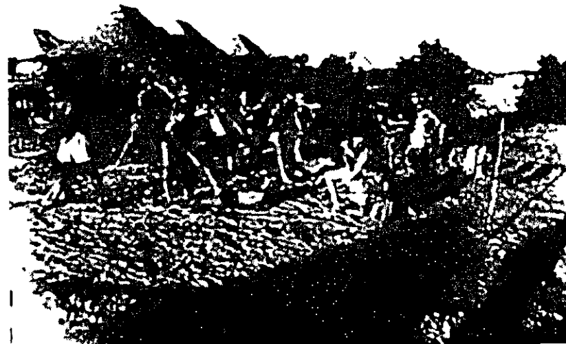
אימונים של צעירי בית"ר במחנות קפריסין (אמ"ז)